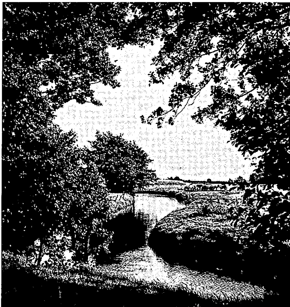
Lieverense diep met Hazematen in het Staats- natuureservaat "Mensinge"

De Duitse sociaal-psycholoog Mitscherlich acht bijvoorbeeld de bezitsverhoudingen ten aanzien van de grond bepalend voor de huidige wijze waarop met name met de steden, maar ook met het landschap wordt omgesprongen. Zonder dat daarmee het laatste woord is gezegd, acht ik het in ieder geval van belang dat wij nagaan welke relaties er bestaan tussen ons produktiestelsel, onze consumptiepatronen en de kwaliteit van natuur- en landschap en niet te vergeten onze steden. Ik denk dat dan best zou kunnen blijken dat met