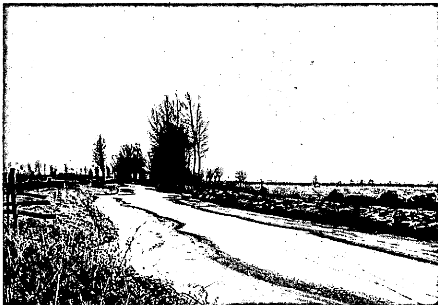
De Huibert in december 1963, ná uitgebreide vellingen.