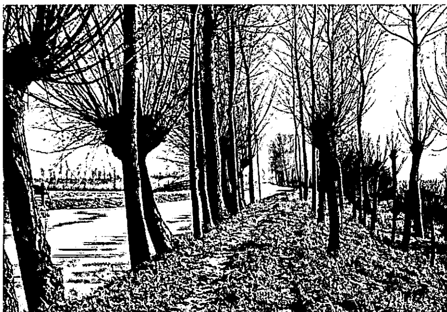
Voetpad langs de Huibert vóór de vellingen, 1963.

(Foto's en gegevens ir. W. D. J. Tuinzing)