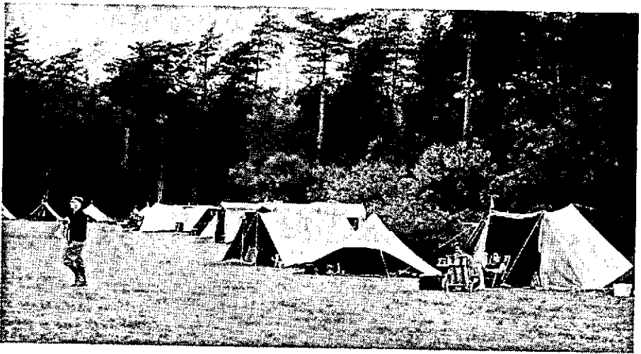
Deel van het A.N.W.B. Landgoedkamp.

Op 3 juni werden in „Berg en Bos” voorts enkele natuurwandelingen gehouden onder leiding van gidsen van het Instituut voor Natuurbeschermings-educatie.