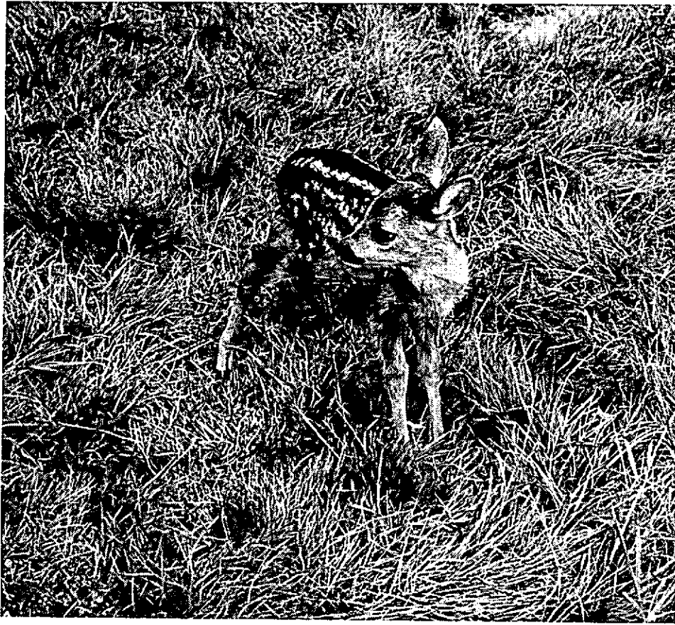
Tijdens de bronst worden de jonge reekalfjes enkele uren of dagen alleen gelaten.