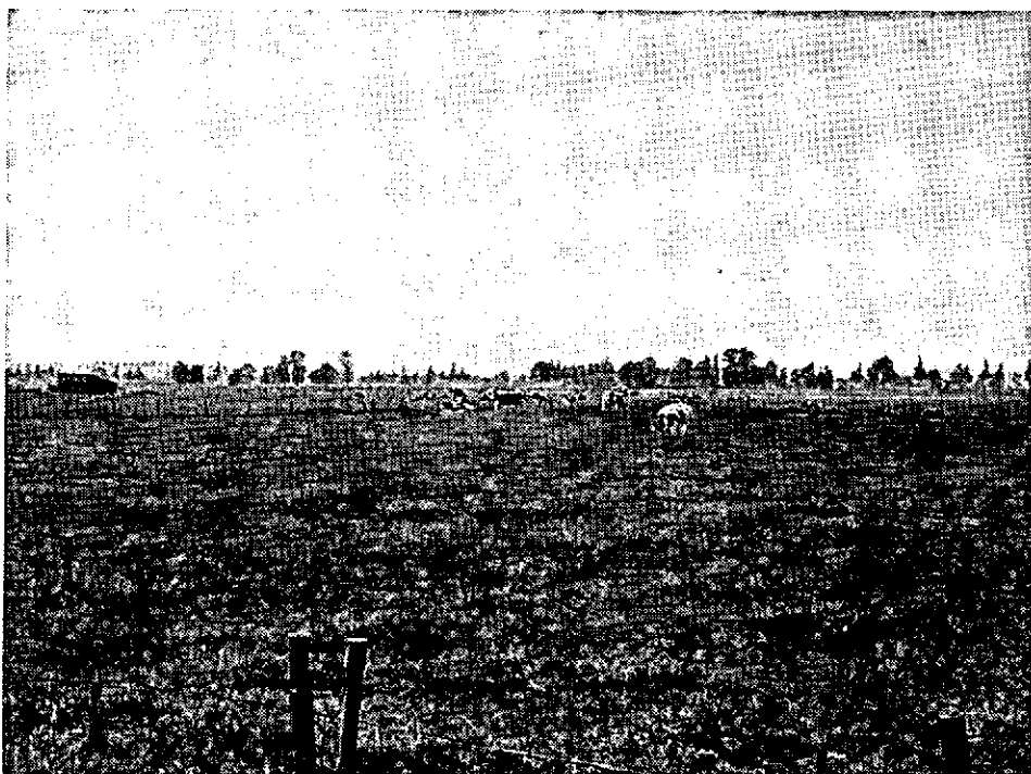
Het open landschap van de Eerbeekse Hoollanden.