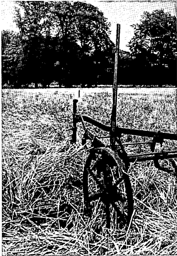
Het gemengd agrarisch boslandschap aan de Veluwerand heeft grote recreatieve waarde.

het visuele aspect van het huidige landschap: