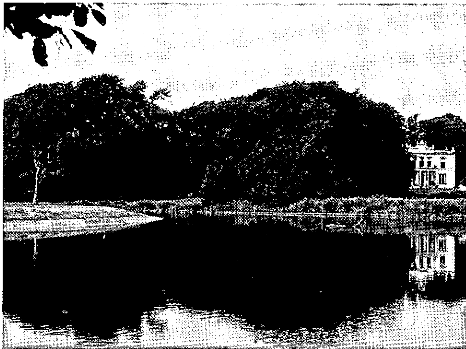
Landgoed 't Schol, gelegen tussen Twello en Deventer. De IJssel wordt a.h.w. begeleid door dergelijke landgoederen.