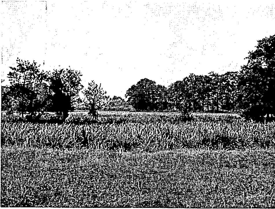
Gesloten coulissenlandschap aan de Voordersteeg ten zuiden van Twello *.