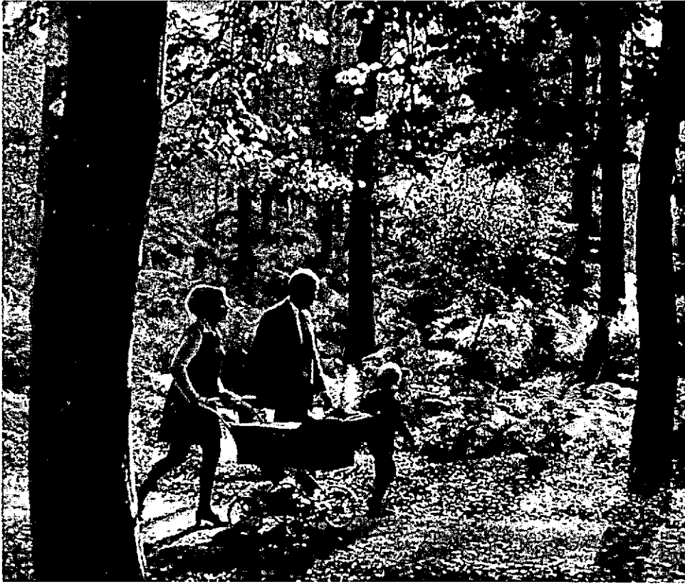
... inhoudelijke variatie naar boom en struik, naar jong en oud, naar vorm en kleur...

derij Welbedrogen, buurtschap Vrouwenverdriet. Mogelijkheden, die voor hem vrijheid van verplaatsing en activiteit moeten waarborgen. Naast bijvoorbeeld watersportgebieden, strand, duin en heide bieden oude cultuurlandschappen en bosgebieden op eigen wijze een verscheidenheid aan indrukken en mogelijkheden.