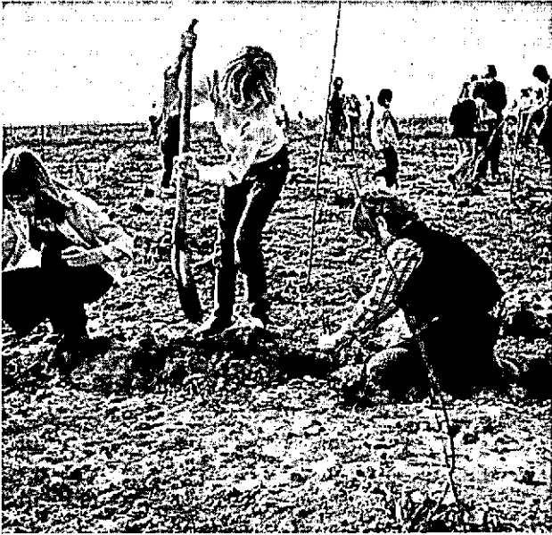
... op deze wijze wordt het vormgeven aan de omgeving — aan het landschap — een samenspel van natuur en mens ...

Gesteld zou kunnen worden dat de mens de omgeving naar eigen goeddunken is gaan veranderen. De mens handelt zo in steeds mindere mate natuurgebonden, hij heeft zichzelf als het ware boven zijn milieu geplaatst. Alle andere organismen heeft hij aan zich ondergeschikt gemaakt; hij heeft zich als soort een riskant dominante positie toegemeten.