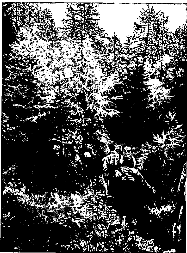
■ Excursie door het berglandschap van de Dolomieten.