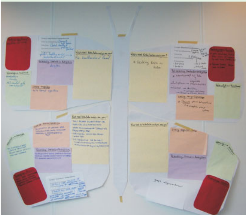
Resultaat workshop 14 september 2005: van 'Rupsje nooit genoeg' naar een vlinder met concrete cases.