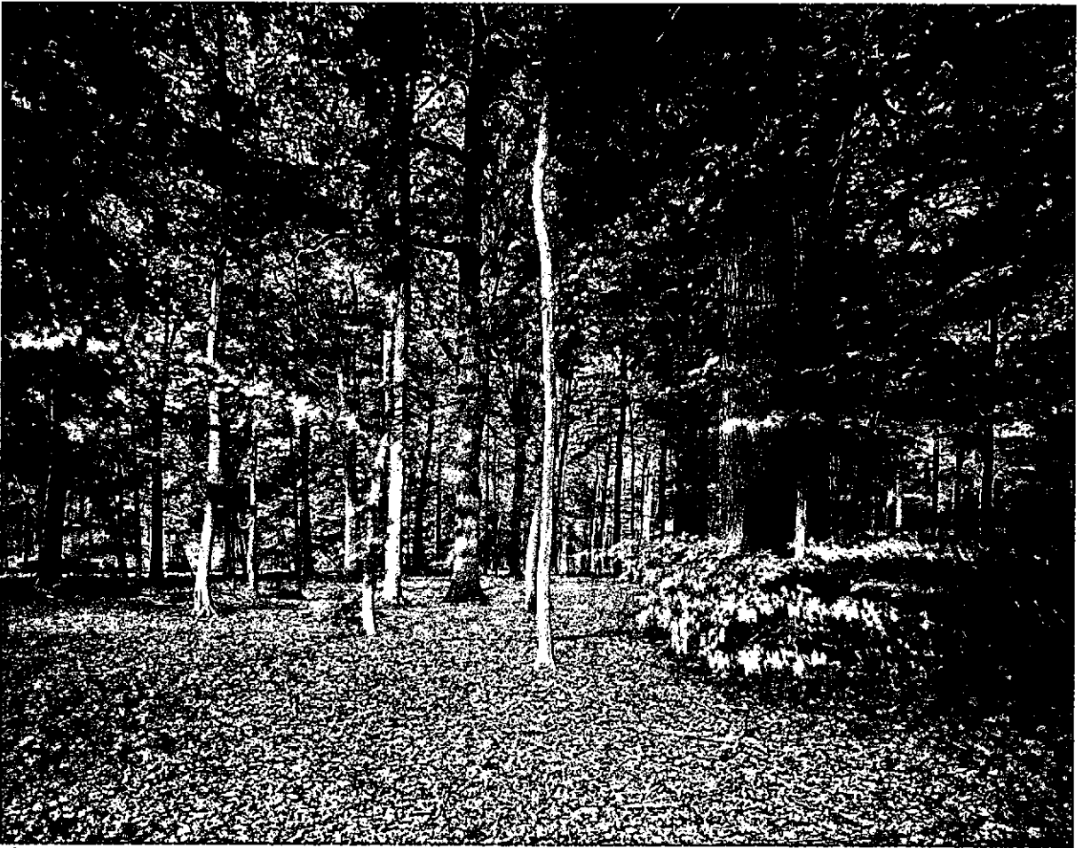
Kerkeheike (vak 17g): eikenbos uit 1806 met onderbeplanting van beuk uit 1894.

in 1871 en 1872 op een leeftijd van circa 49 jaar, in de legger aangeduid als bij "dunning" met het aantal bomen en kavels en de opbrengst. Verkocht werden 1372 eiken tegen gemiddeld f 2,- per stuk of 40% van het aantal in 1841. In 1883 volgde dan op 60 jaar nog een dunning van 678 eiken die gemiddeld f 4,68 per stuk opbrachten waarmee in totaal 59% was verwijderd. Na deze dunning bedroeg de gemiddelde afstand tussen de bomen 7,2 m.