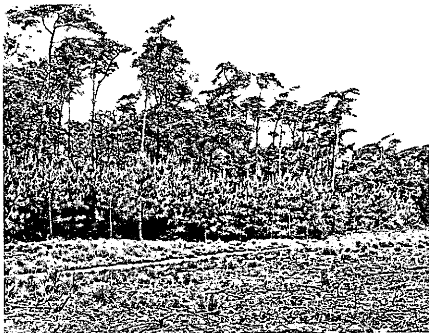
2e Liesenberg (vak 9b): groveden uit 1890, geplant op 0,80 × 0,80 m.

2e Liesenberg , vak 9 heeft nog een restant van een in 1890 aangelegde beplanting van groveden. In 1619 lag de westelijke helft nog buiten het toenmalige Liesbos (bouwland?), in 1782 binnen de huidige grens en toen bezet met mast en eik. De legger van 1829 omschrijft