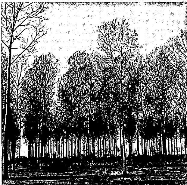
Beplanting van populieren tussen Oirschot en Spoorndonk, gezien vanaf de Beerse.

Ten eerste: de steeds krappere wordende marge tussen wereldhoutverbruik en potentiële wereldhoutproductie zou in de ontwikkelde landen aanleiding moeten zijn om, zonder de andere functies van het bos tekort te doen, grote aandacht te besteden aan de verhoging van de houtproductie.