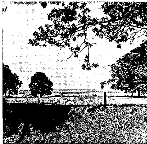
Blik op het veengebied bij Exloo. Reeds enkele vrijstaande bomen verbeteren het landschap hier aanzienlijk.

verkeert zoals uit het voorgaande is gebleken in verschillende fasen van concretisering.