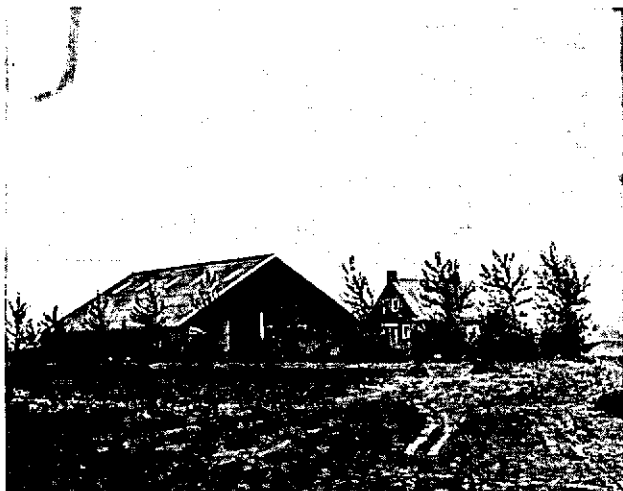
Erfbeplanting rondom nieuwe boerderij. Ruilverkaveling „Veendam-Wildervank”.