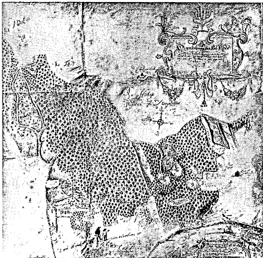
Grondtekening van het Rheder Bos door P. van Lint (1649). Scherpe grens tussen het bos en de noordelijk gelegen heide; het ooste- lijk gedeelte (no's 6-11) wordt onderdeel van het later gestichte landgoed Rhederoord.

Dat uitvoerige stuk wijst op de bepalingen van het B.W. omtrent minderjarigen, stelt onder meer de vragen in hoeverre de wet van Lodewijk Napoleon op de verdeling van marken alsnog van toepassing is en wijst op de verblijvende gevolgen, welke de markeverdeling bereids in Gelderland en Overijssel