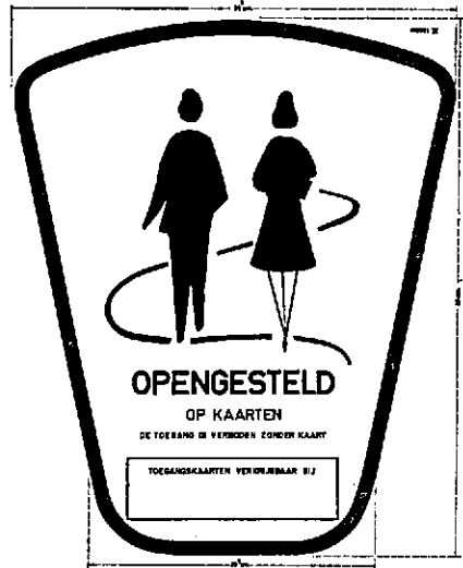
Zwart uitgevoerd in wit, behoudens dikke omranding uitgevoerd in rood, wit uitgevoerd in groen

Tenslotte werd model III ontworpen voor die gevallen waarin de openstelling geschiedt op kaarten. Dit zijn uitzonderingsgevallen, namelijk wanneer alle andere middelen van gedeeltelijke of periodieke afsluiting onvoldoende zijn om het object te beschermen tegen eventuele schade door het publiek.