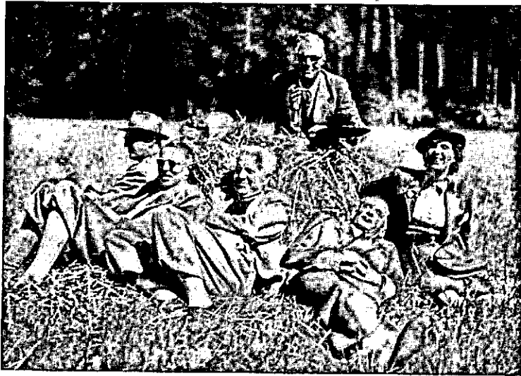
Na de lunch