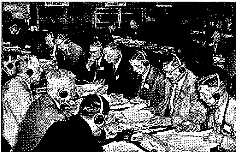
De congreszitting in Parijs 1957.