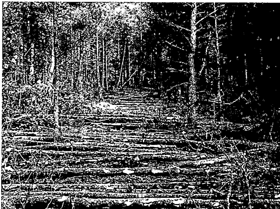
Langhoutmethode tot rijpad: geslept langhout loodrecht op het rijpad, alwaar wordt gekort en gestapeld.