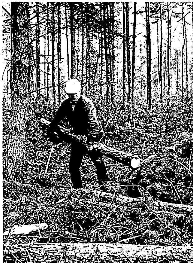
Sortimentenmethode: dragen en stapelen van sortiment.