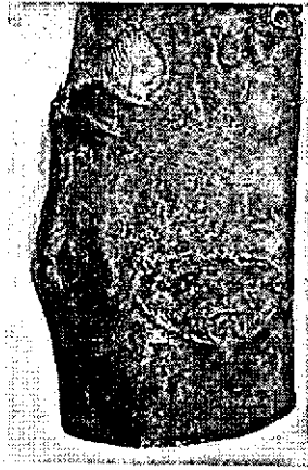
Fig. 1. Schurftige plek waarin wintergangen bij een taklitteken op een gezonde twijg.

Scabby spot in which wintergalleries near the scar of a twig on a healthy branch.