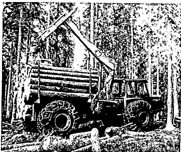
Foto 2 Het uitrijden van sortiment langs een rijpad met een twee-assige gelede trekker, met vierwielaandrijving, kraan en 12 ton laadcapaciteit.

satie bij vellen t.e.m. stapelen de methode arbeidsintensief is.