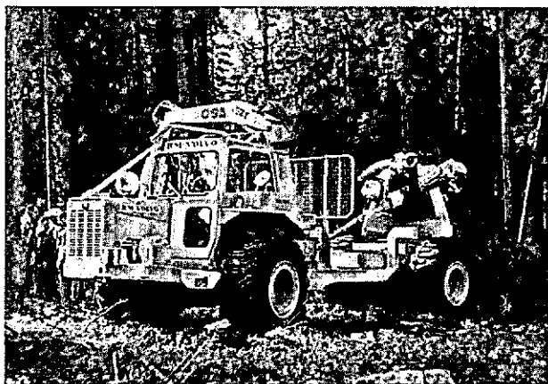
Foto 6 Een "feller/skidder" voor het vellen en uitslepen van dunningshout. Theoretisch bewerkstelligt deze machine, tezamen met een "limber/bucker" zoals bijvoorbeeld de "schroef" de volledige mechanisatie van de oogst van standaardsoortiment volgens de boommethode.