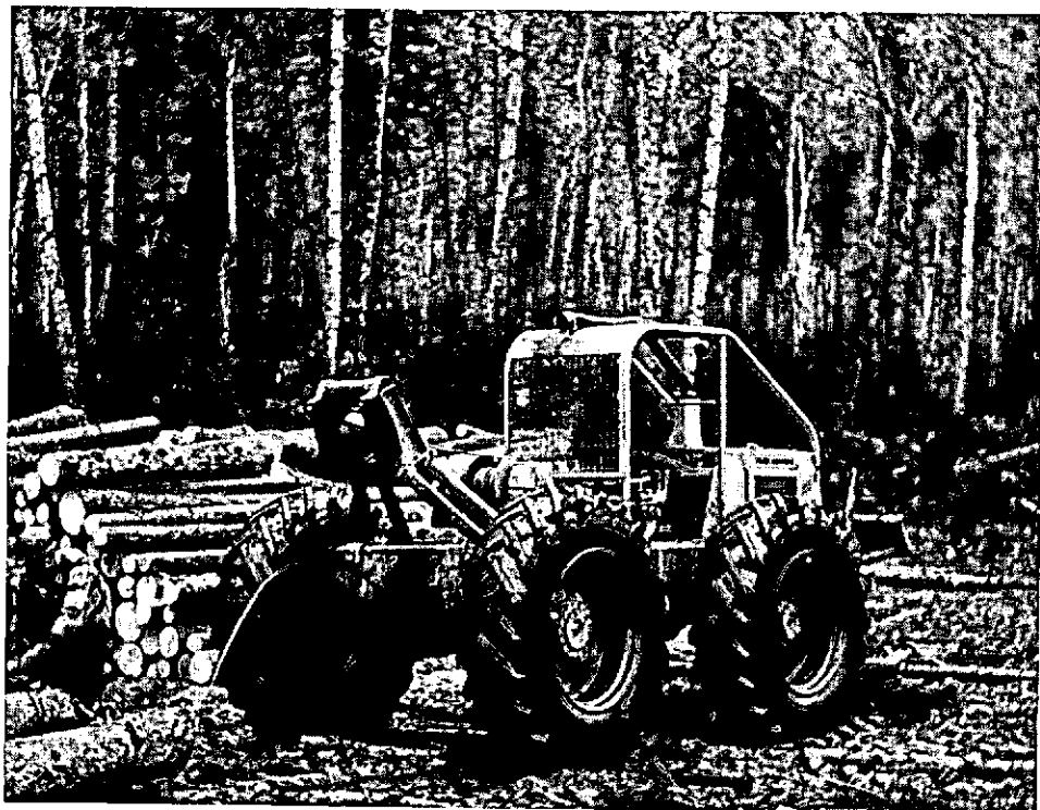
Foto 3 Gelede trekker met vierwielaandrijving voor het uitslepen van langhout met behulp van lier en uitsleepkabels.

a In oudere dunningsopstanden kan het langhout na vellen en snoeien door bosbouwtrekkers met lier of grijper (motorvermogen 70-120 SAE pk; prijs orde van grootte f 80.000; bijvoorbeeld Treefarmer, Timberjack, BM-Volvo, Flexor) naar de bosweg worden gesleept en daar worden gekort of als langhout worden afgevoerd (foto 3).