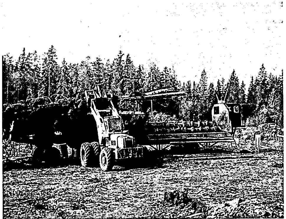
Foto 5 De schroef. Een "limber/bucker" die op de bosweg opereert en meerdere bomen tegelijk kort en snoelt.