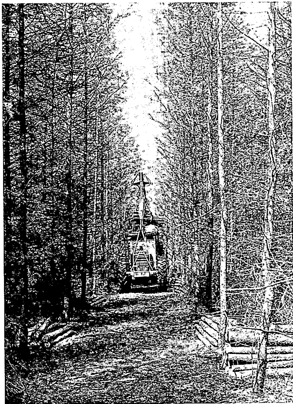
Foto 1 Opstandsontsluiting met rijpaden op onderlinge afstand van ca 20 m bij de sortimentmethode. Afvoer door een twee-assige trekker met kraan en bogietrailer. Het hier afgebeelde rijpad van 3 m breed is te smal; de breedte moet 4 m zijn.

Nu in Nederland standaardassortiment een grotere rol gaat spelen bij de houtafzet is de sortimentmethode voor ons land van belang. Bedacht moet echter worden dat door de lage graad van mechani-