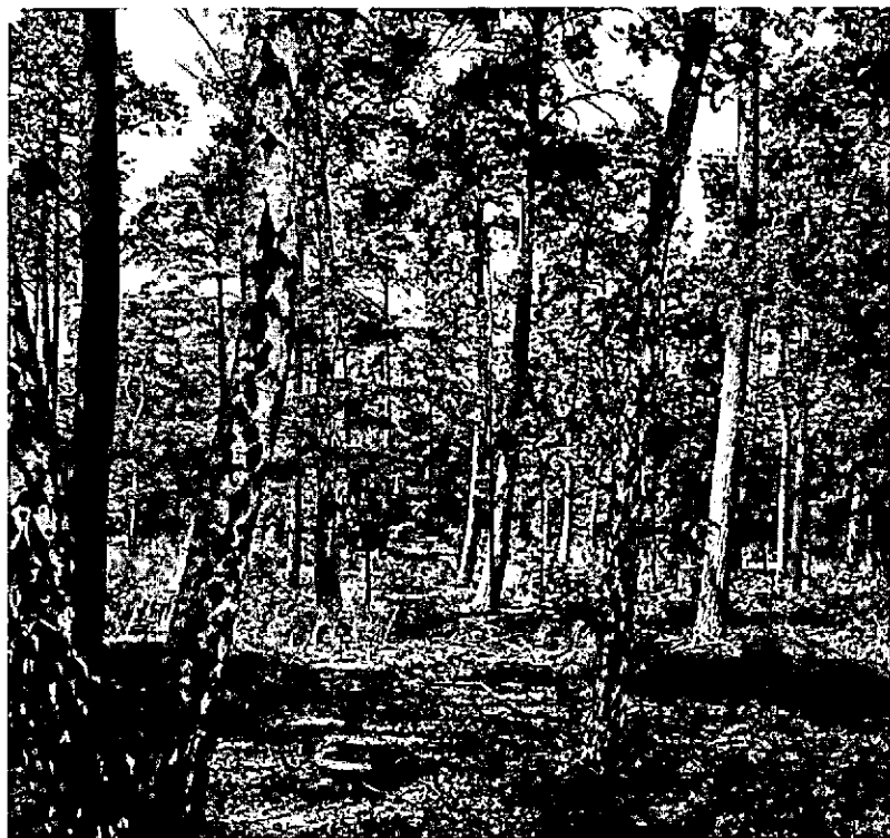
Voorbeeld bosgebruikstype groveden met inlandse loofboomsoorten, accent op natuurbeheer.