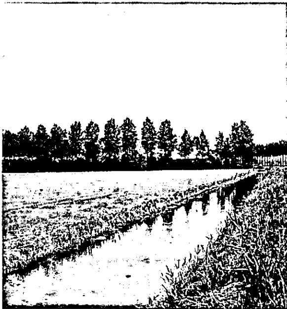
Erfbeplanting van populier met op de achtergrond wegbeplanting.