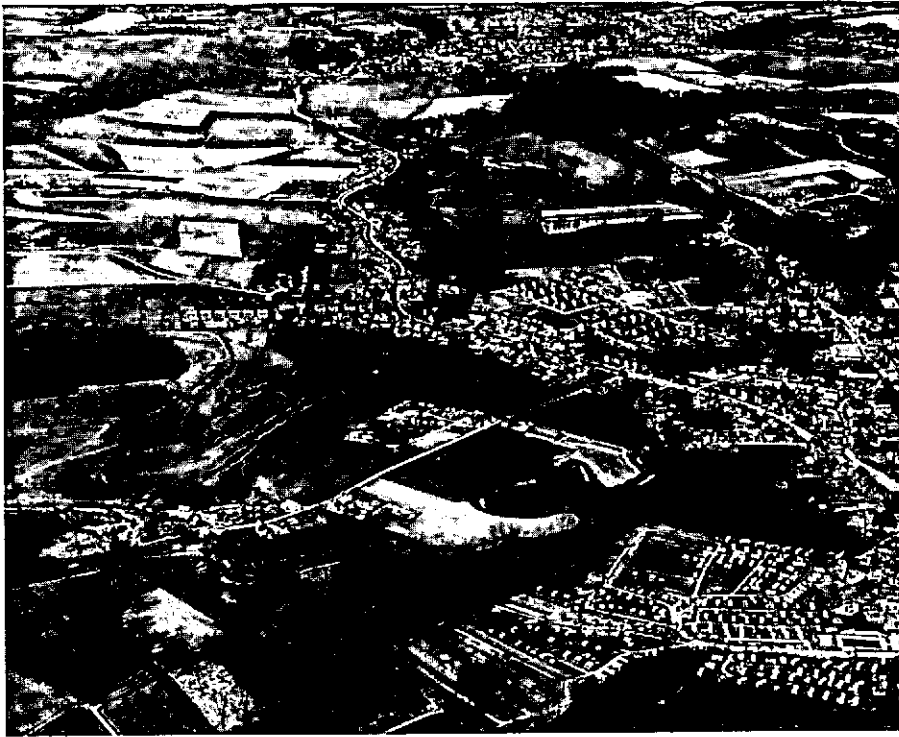
De Geul bij Schin op Geul. De grote bevolkingsdichtheid van Nederland is een hinderpaal voor het realiseren van Nationale Landschappen.

aanmerking komende gebieden een oppervlakte van ongeveer 500.000 ha of ca. 15% van het Nederlandse grondgebied. Of dit (te) veel of (te) weinig is, laat ik aan het oordeel van de lezer over.