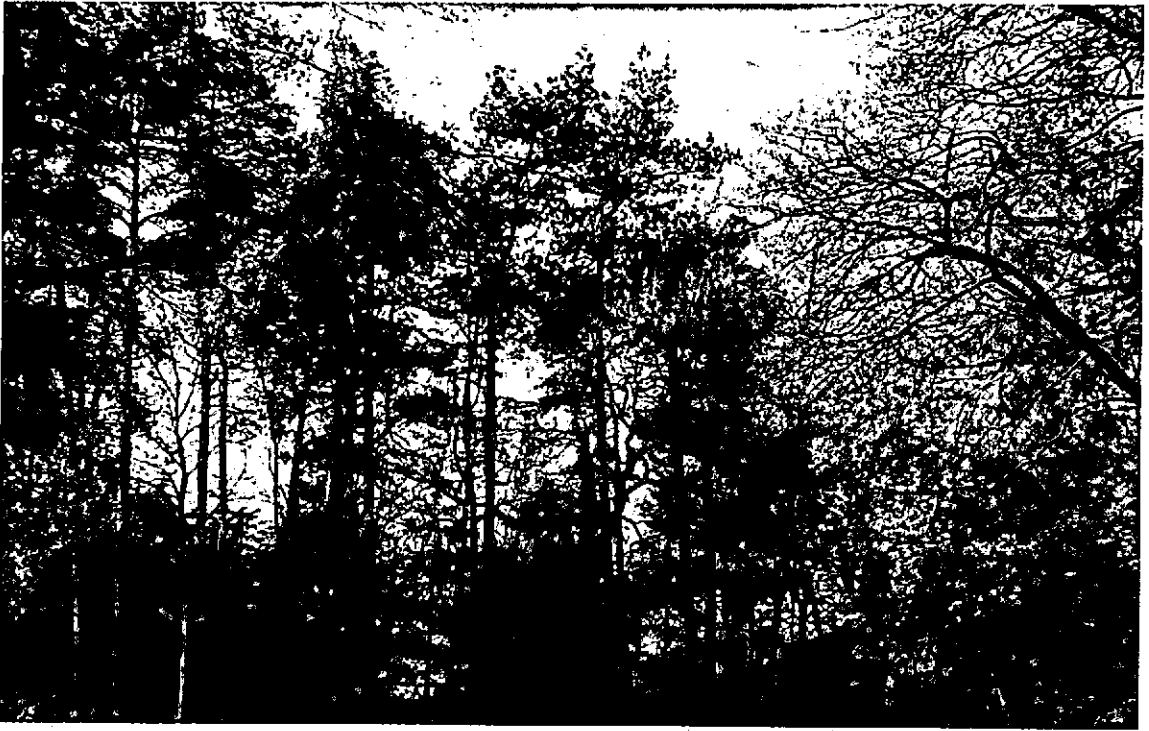
Een dynamisch landschap. "Gezicht" op Doorn. Dezelfde plaats als afbeelding hieronder. Mei 1981.