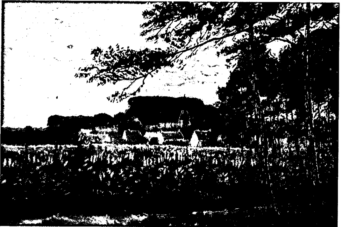
Gezicht op Doorn vanaf de Utrechtse Heuvelrug. Olieverfschilderij van C. L. Stricker. Zomer 1919. Particuliere collectie.