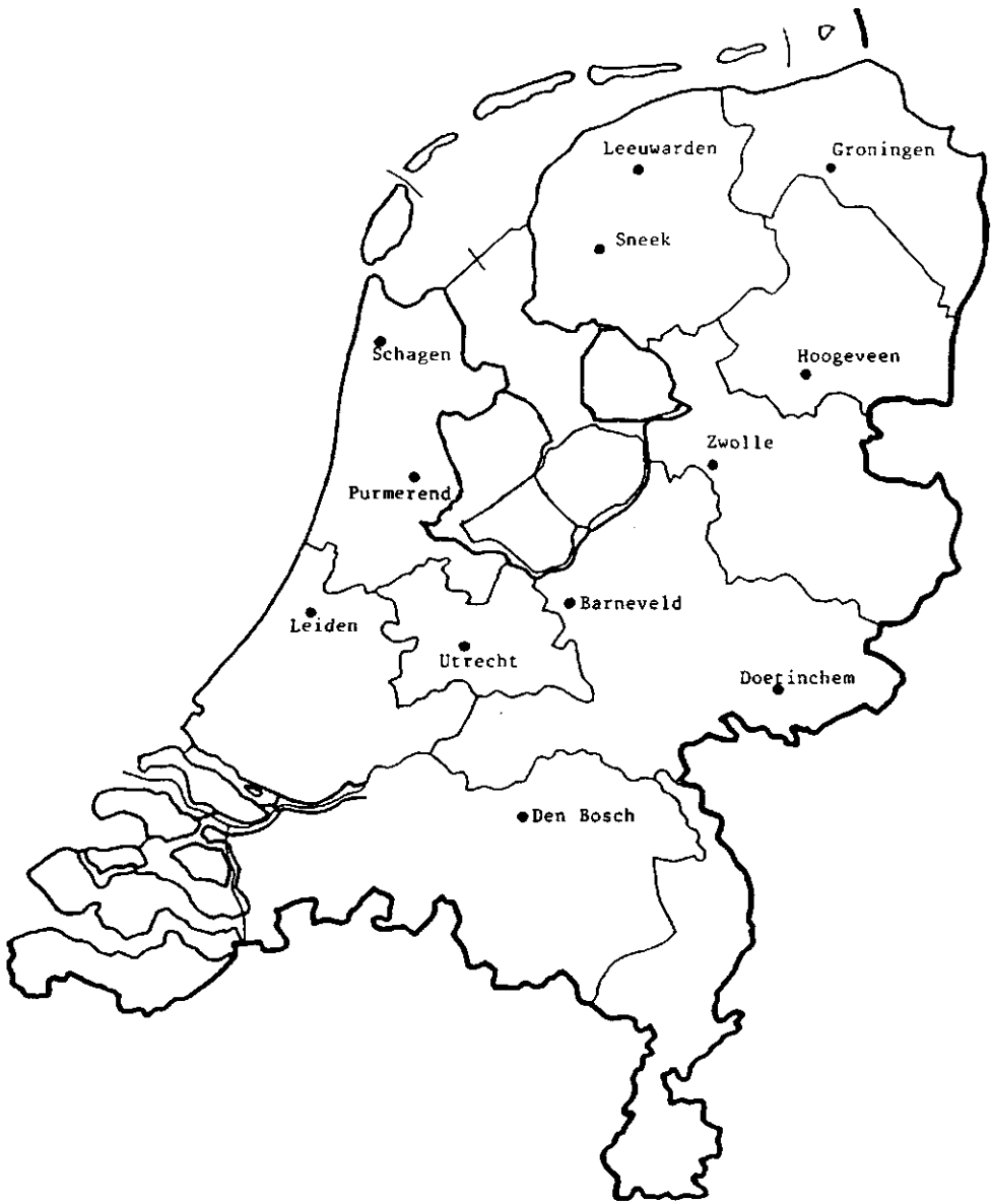
Figuur 3.2 De geografische ligging van de veemarkten