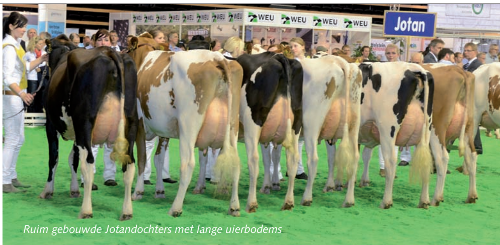
Ruim gebouwde Jotandochters met lange uierbodems

India (v. Goldwyn), kampioene vaarzen Prod.: nog onbekend