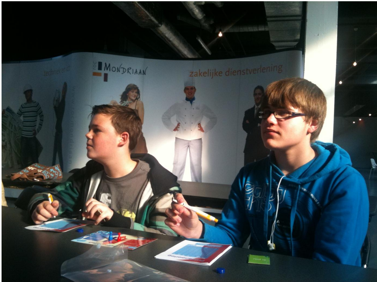
De tweede workshop, die ging over ondernemerscompetenties, was meer een cabaretvoorstelling waarin de leerlingen op een totaal andere wijze actief betrokken werden. Zie foto: