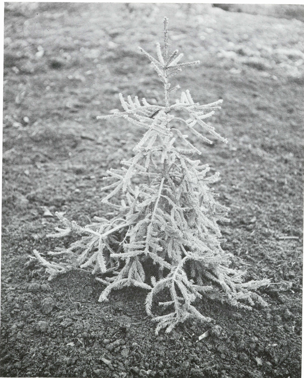
Picea abies 'Frohburg'