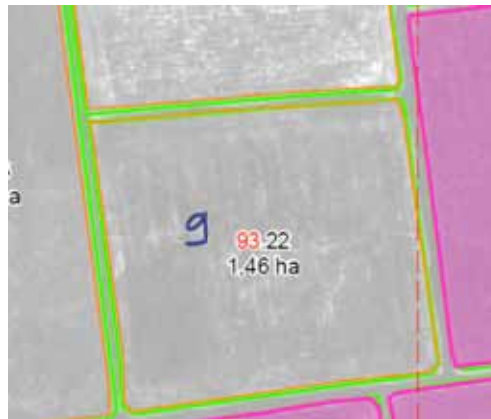
Voorbeeld overgenomen beheereenheid

Staan niet alle beheereenheden op de Kaart beheereenheden (SNL-a)? Vraag dan een extra Kaart beheereenheden (SNL-a) aan. Dat kan bij het DR-Loket. Hou uw relatie-nummer bij de hand. Na ongeveer vijf werkdagen heeft u de Kaart beheereenheden (SNL-a) in huis. U kunt uw opgave ook via internet doen. U hoeft dan niet te wachten op een nieuwe Kaart beheereenheden (SNL-a), maar u kunt direct uw nieuwe beheereenheden opgeven.