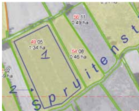
Voorbeeld gewasstrook of faunarend

Teken een strook op dezelfde manier in als uw gewaspercelen en plaats het corresponderende volgnummer van het formulier Opgave Gewaspercelen in het gewasperceel. Een millimeter op de bedrijfskaart is vijf meter in werkelijkheid. Teken nauwkeurig in want het is nodig dat de oppervlakte van een gewasperceel op de bedrijfskaart overeen komt met de oppervlakte die u opgeeft op het formulier.