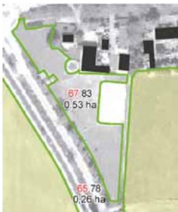
Voorbeeld niet-beteelbare oppervlakten

Zijn er niet-beteelbare oppervlakten in uw gewasperceel, en zijn deze oppervlakten niet groen omlijnd (zie hierboven)? Teken dan de grenzen van deze niet-beteelbare oppervlakten in op de kaart. Is het lastig om bijvoorbeeld een kavelpad of een houtwal in te tekenen? Teken dan het gewasperceel volledig in, inclusief het kavelpad of de houtwal. U brengt vervolgens de niet-beteelbare oppervlakte in mindering op de beteelbare oppervlakte.