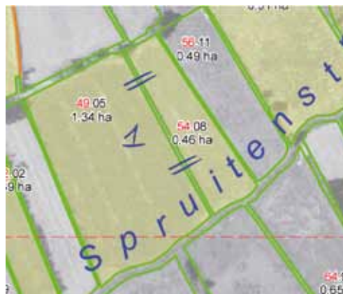
Voorbeeld corrigeren van perceelsgrenzen

Komen de bedrijfskaart en de voorgedrukte perceelsgrenzen niet overeen met de situatie op 15 mei 2013? Bijvoorbeeld als er kortgeleden een ruilverkaveling is geweest, een nieuwe weg is aangelegd of een sloot is gedempt. Zet dan met een blauwe pen kleine dwarsstreepjes door de grens die vervalt. Teken vervolgens het gewasperceel in zoals het in werkelijkheid is. Bepaal dan de betaalde oppervlakte van het gewasperceel en zet deze oppervlakte in de kolom Betaalde oppervlakte op het formulier Opgave Gewaspercelen. Gaat het om een wijziging in de gewasperceelsgrens die gelijk loopt met de grens van het topografische perceel? En is de topografische grens hierdoor dus ook gewijzigd? Dan geeft u het op formulier Opgave Gewaspercelen in de kolom Wijziging topografische grens van het gewasperceel aan wat de reden van de wijziging is en wat de datum is van de wijziging. U kunt kiezen uit een aantal redenen, zie Tabel 8.