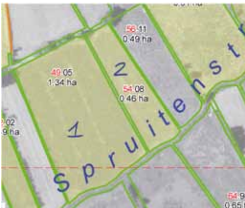
Voorbeeld volnummer invullen

Geef alleen de gewaspercelen op die u op 15 mei 2013 in gebruik heeft. Heeft u het gewasperceel niet meer in gebruik, maar staat deze wel geel gekleurd op de bedrijfskaart weergegeven? Vul dan géén volnummer in. Dan wordt dit gewasperceel niet bij u geregistreerd. U hoeft niet apart aan te geven dat u dit gewasperceel niet meer gebruikt.