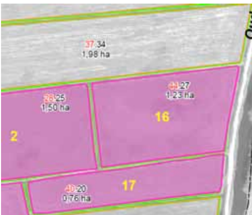
Voorbeeld beheereenheden met volgnummer

Op de Kaart beheereenheden (SNL-a) staan de beheereenheden die aan u zijn toegewezen. Het kan zijn dat uw subsidieaanvraag nog in behandeling is en dat u de aangevraagde gegevens ziet. Op de achterkant van het formulier Verzoek Uitbetaling subsidie agrarisch natuur- en landschapsbeheer staat hoe u dit kunt herkennen en wat dit voor u betekent. De beheereenheden zijn weergegeven in de kleur roze. De grenzen zijn met een roze lijn afgebeeld. Dienst Regelingen heeft in de beheereenheden die aan u zijn toegewezen een volgnummer voorgedrukt. Dit volgnummer komt overeen met het volgnummer in de eerste kolom op het formulier Verzoek Uitbetaling subsidie agrarisch natuur- en landschapsbeheer.