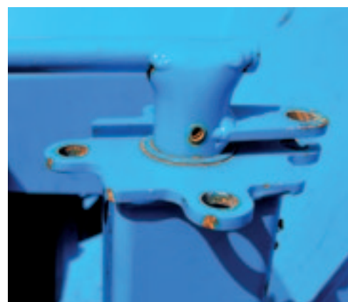
De spindel kun je vergrendelen in vier standen met een zelfborgend pennetje.