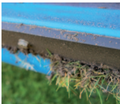
Tussen de kunststof rol en de schrapper willen wel eens resten achterblijven.