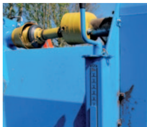
Hoogteverstelling gaat met twee spindels. Je maakt veel slagen voor een kleine verstelling.