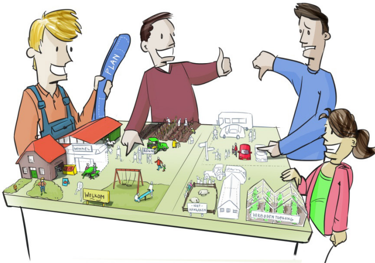
Consumentenperspectief op groei multifunctionele bedrijven