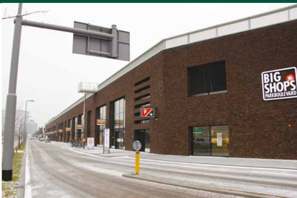
De winkels aan de voorkant van het bovenliggende Dakpark.