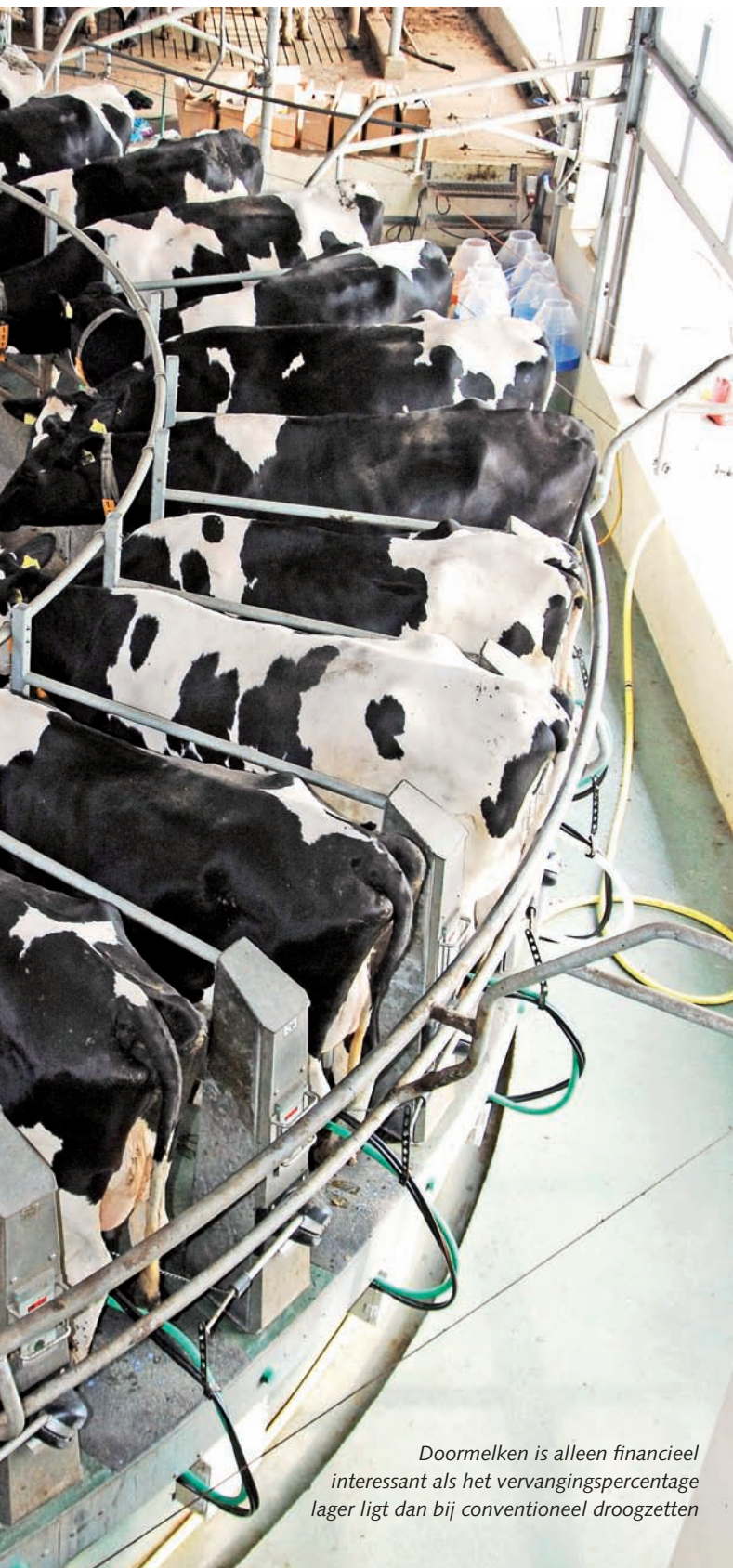
Doormelken is alleen financieel interessant als het vervangingspercentage lager ligt dan bij conventioneel droogzetten

drijven te bepalen, zijn modelberekeningen gemaakt voor twee bedrijven met als verschil conventioneel droogzetten of doormelken. Het model maximaliseert de arbeidsopbrengst van elk bedrijf en is representatief voor een standaard gespecialiseerd melkveebedrijf in Nederland. Als bedrijfsopzet is gekozen voor een gemiddeld Nederlands melkveebedrijf met 49 hectare grond, een melkquotum van 658.600 kilogram met 4,68 procent vet, een stalcapaciteit voor melkvee en jongvee van in totaal 131 dieren en een arbeidsaanbod van 3995 uur per jaar.