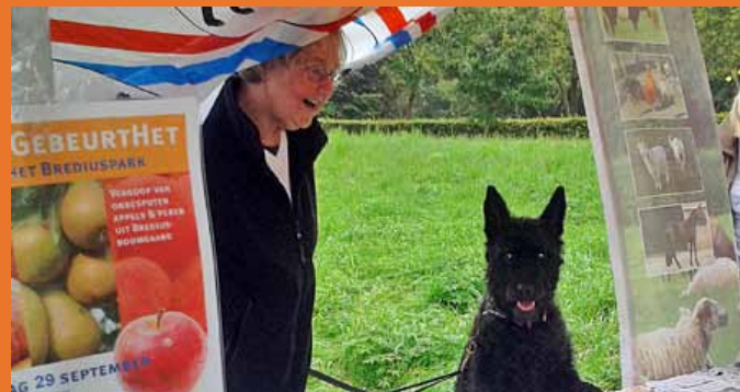
Ras van het jaar promoot zichzelf