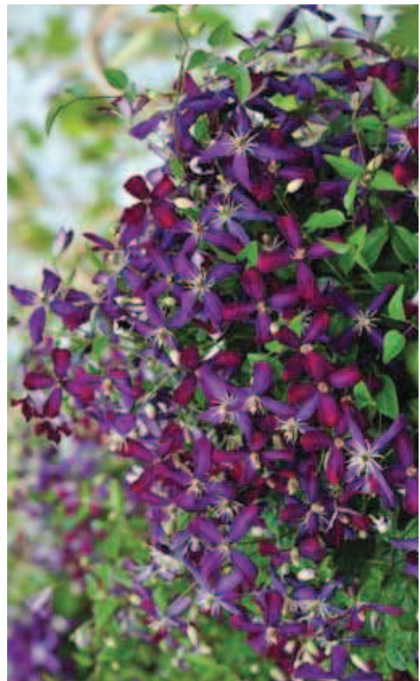
118. Clematis 'Sweet Summer Love'