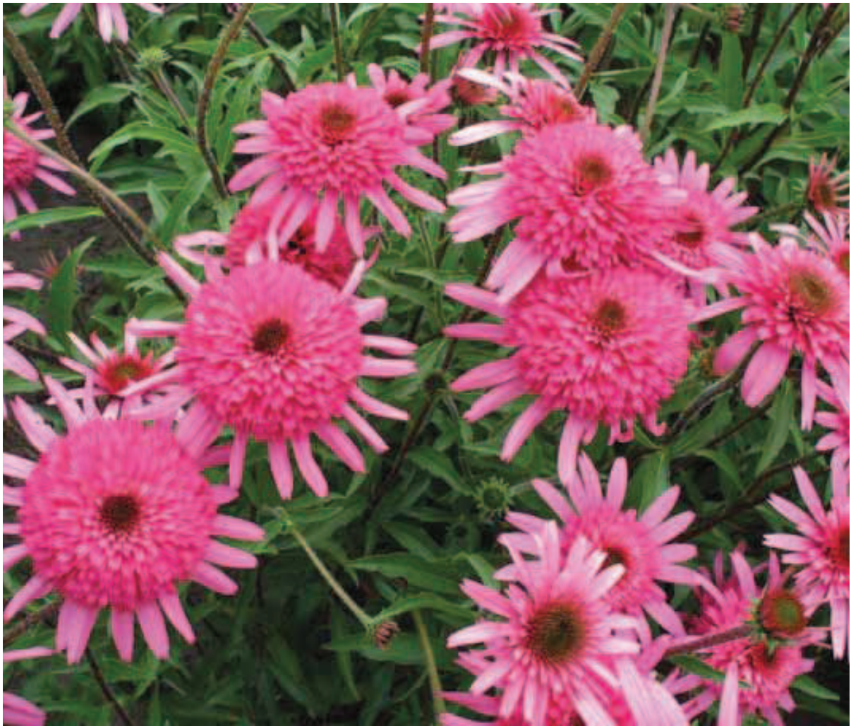
119. Clematis 'Southern Belle'

thern Belle' groeit opgaand maar als de planten vroeg in het seizoen een keer teruggeknipt worden zullen ze goed vertakken en op iedere stengel meerdere bloemen dragen. De bloemhoofdjes hebben een doorsnede van circa 10 cm en bestaan uit de voor Echinacea typische lintbloemen en een centrum van buisbloemen. De lintbloemen zijn iets naar beneden gericht en zijn warm rozerood. De buisbloemen zijn beduidend groter dan bij de wilde soorten en hebben nagenoeg dezelfde diepe rozerode kleur. De bloemen verbloeien nauwelijks bij uitbloeien.