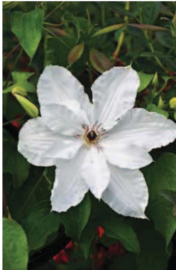
116. Clematis ‘Beautiful Bride’

Snelgroeijende klimplant tot circa 3 m hoogte met donkergroen blad. Lange bloeitijd van juni tot in september. De klokvormige bloemen hangen niet naar beneden, maar staan min of meer zijwaarts gericht. Ze bestaan uit vier tepalen die roze met een rozerode centrale band van