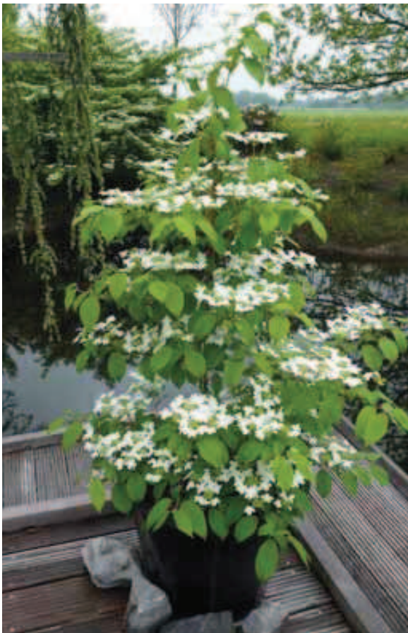
126. Viburnum plicatum 'JWW1' (KILIMANDJARO)

heeft als 'Smaragd'. Het loof is niet helder donkergroen, zoals bij 'Smaragd', maar helder groengeel. In het voorjaar is het jonge loof duidelijk geler. Het is een uniform groeiende (haag) conifeer die uit zichzelf goed vormt en een "rustige" gele loofkleur heeft.