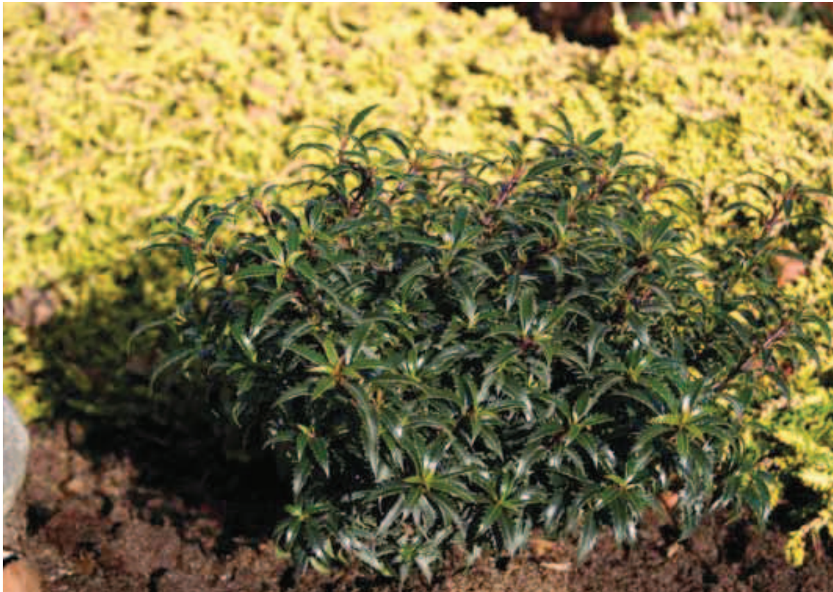
122. Ilex aquifolium 'Hachzwerg' (HECKENZWERG)

Bijna jaarlijks brengt de Deense winner één of meerdere nieuwe cultivars van Lavandula stoechas op de markt. En bijna altijd zijn het ook verbeteringen van het bestaande sortiment. 'Giant Summer' vormt hierop geen uitzondering. Het is een stevige, compacte plant met een dichte vertakking. De vele takken vormen allemaal bloemen. Het meest opvallende deel van de bloeiwijze, de bundel bracteeën op de top, is lichtpaars van kleur. De eigenlijke bloemen staan in verticale rijen in de bloeiwijze. Deze zijn purperviolet met oranjegele meeldra-