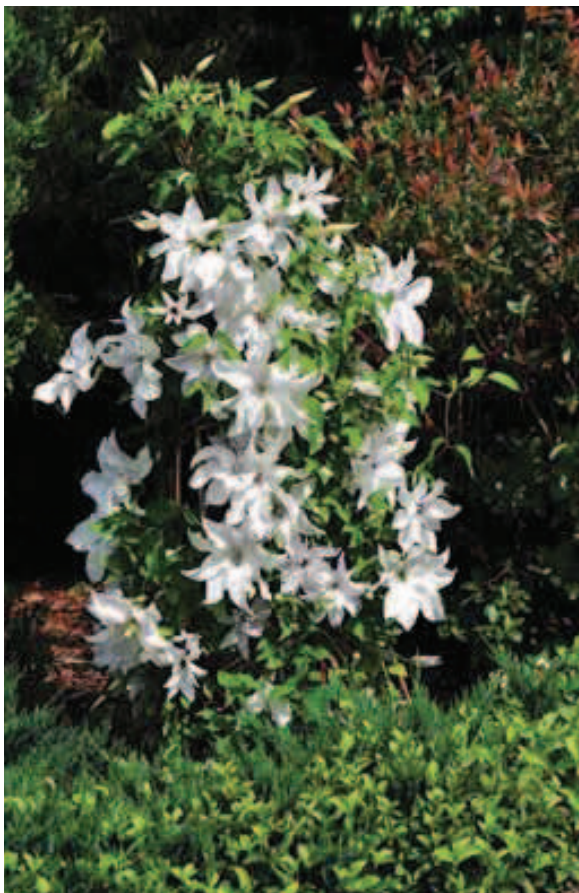
115. Clematis ‘Beautiful Bride’