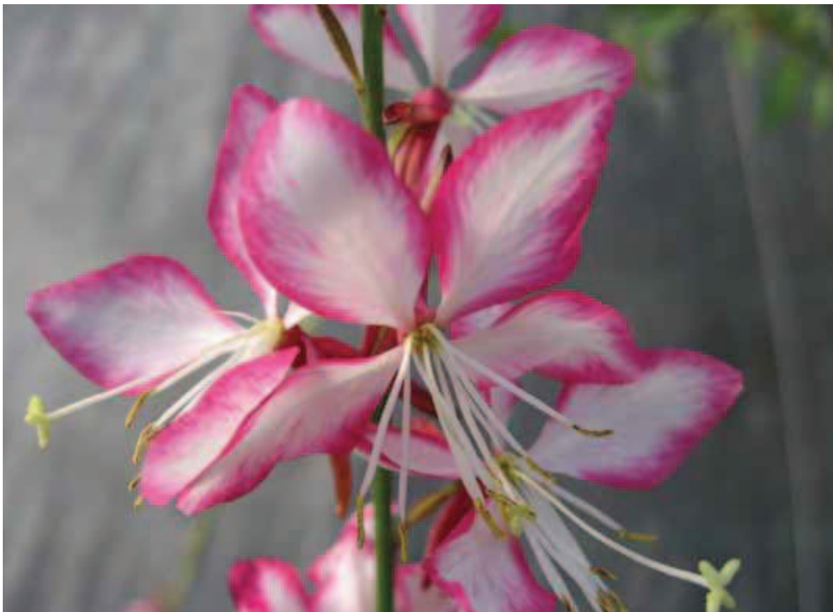
120. Gaura lindheimeri 'Harrosy' (ROSYJANE)

Breed opgaande bladverliezende struik, qua habitus en blad gelijk aan 'Annabelle'. Ook de bloeiwijzen hebben dezelfde halfbolvormige vorm, maar ze zijn beduidend groter dan bij 'Annabelle'. Dit manifesteert zich vooral als de planten enige jaren vaststaan. Waar de bloeiwijzen van 'Annabelle' geleidelijk kleiner worden, zullen ze van 'Abetwo' (STRONG ANNABELLE / INCREDIBALL) juist forser zijn. Ook zijn de twijgen steviger, waardoor ze minder snel doorbuigen als de bloeiwijzen natgerend zijn.