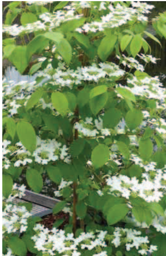
127. Viburnum plicatum 'JWW1' (KILIMANDJARO)

Door de bijzonder opvallende groeiwijze valt 'JWW1' direct op. De plant is groeikrachtig en