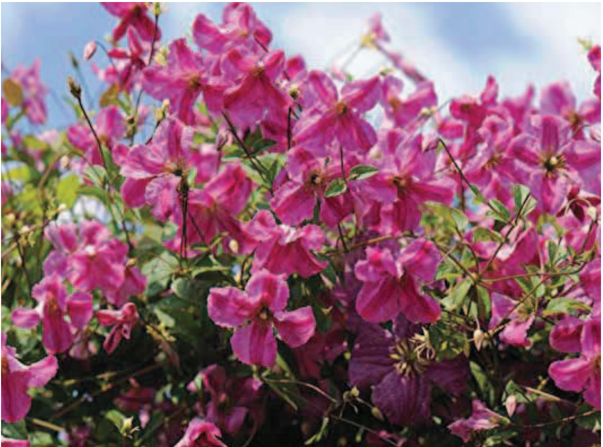
117. Clematis 'Krakowiak'

kleur zijn. De getoonde planten waren uitstekend gepresenteerd.