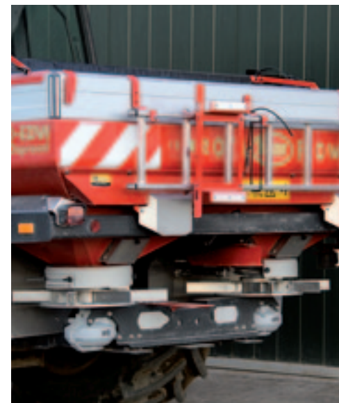
▲ Voor het honderdjarig jubileum werden enkele RotaFlow-strooiers in het zwart gespoten. achter de twee aluminium plaatjes zitten de weegcellen.