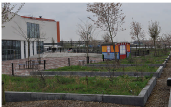
De plantenbakken van Wittering.nl die binnenkort gevuld gaan worden.

De werkgroep voor de Wittering en het Boschveld is ook opgestart en op deze scholen zullen binnenkort natuurroutes ontwikkeld worden en plantenbakken gevuld.