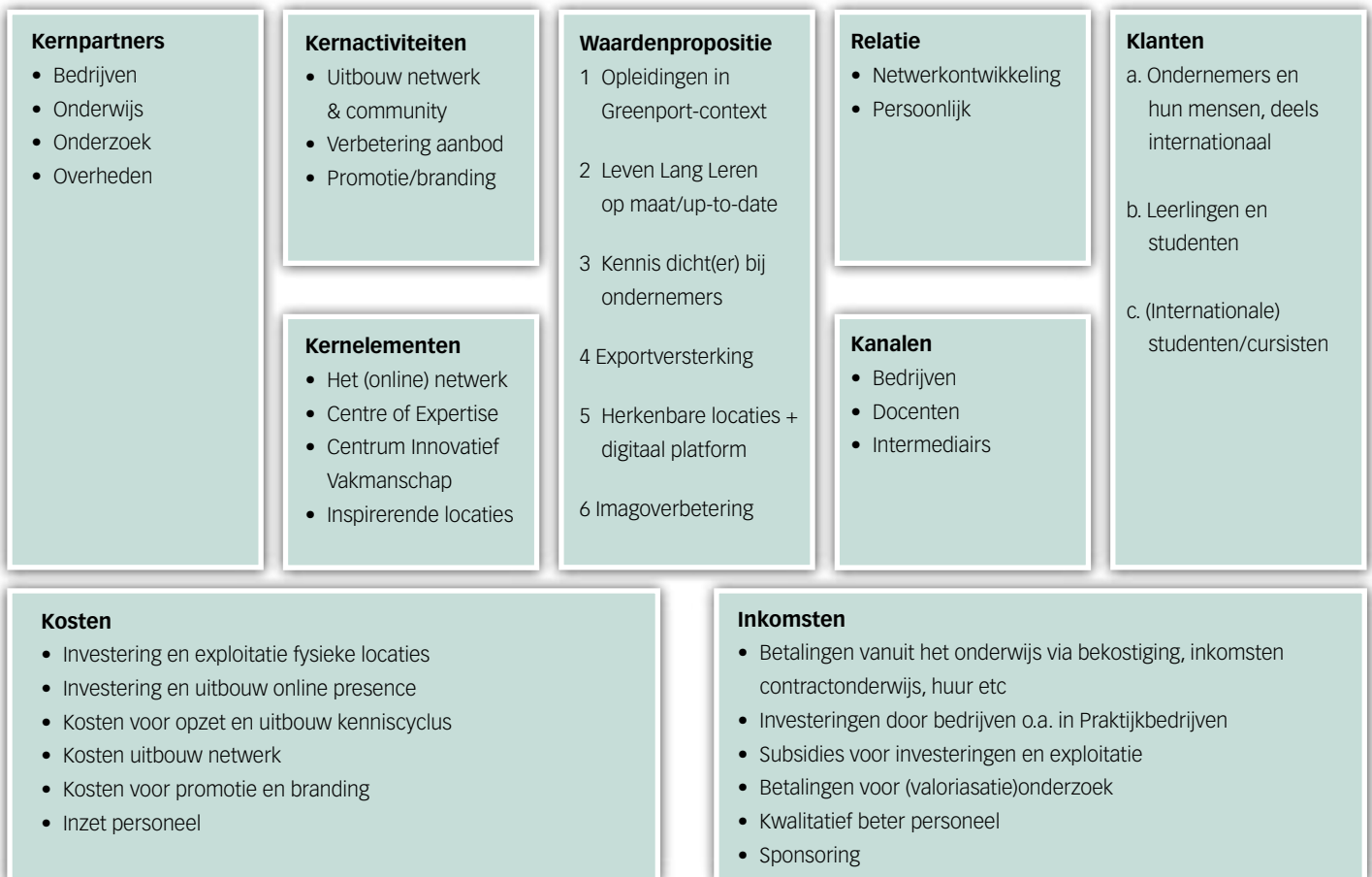
Figuur 3 – Businessmodel Greenport Horti Campus

Het businessmodel van de Greenport Horti Campus ziet er daarbij als volgt uit: