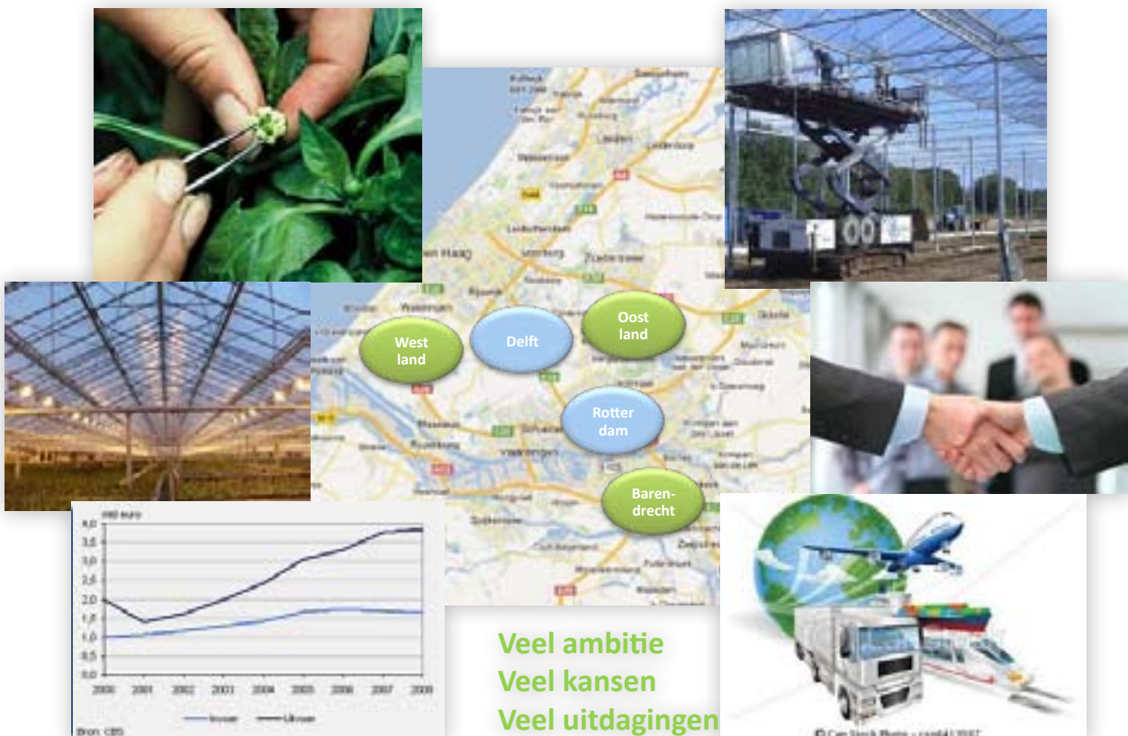
Figuur 1 - Het brede Greenport-cluster in Westland-Oostland-Barendrecht

Deze doelstellingen betreffen het brede Greenport-cluster in Westland, Oostland en Barendrecht zoals opgenomen in figuur 1. Belangrijke kenniscentra zijn daarbij Delft en Rotterdam.