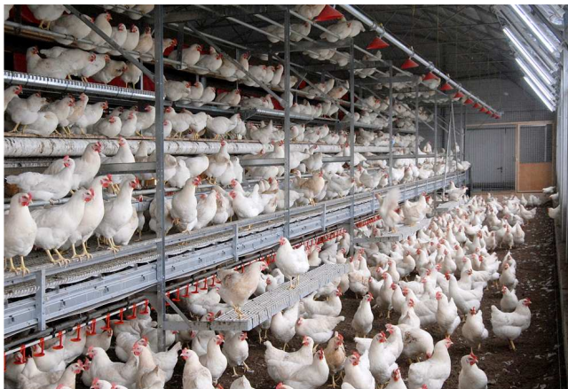
Volièrestal met leghennen

In Nederland (in de EG) is traditionele batterijhuisvesting voor leghennen verboden. De nog toegestane vormen van kooihuisvesting zijn de verrijkte kooi en koloniehuisvesting. Beide zijn grotere kooien voor groepen dieren. In de kooien (met roostervloer) zijn een scharrelgelegenheid (vaak een rubberen mat), zitstokken en een legnest (afgeschermd hoek) aanwezig. De voervoorziening kan buiten de kooi langs lopen (voergoot met ketting) of door de kooien heen (zowel voergoot als voerpannen). De drinkwatervoorziening loopt door de kooien. Onder de kooien is een mestband aanwezig waarmee de mest 2x per week uit de stal wordt gehaald. De mest wordt gedroogd met lucht uit PVC-buizen. De verlichting kan zowel tegen het dak zijn gemonteerd als tussen de rijen met kooien. Meestal zijn het hoog frequente TL-buizen. Ook komt verlichting gemonteerd in de kooien voor.