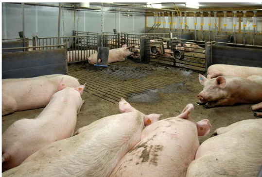
Dragende zeugen in groepshuisvesting

Op (oudere) bedrijven met bestaande bebouwing wordt de materiaalkeuze van nieuwe stallen vaak afgestemd op het bestaande. Op oudere bedrijven zien we vaak verschillende, relatief kleine stallen met afmetingen van ca. 15 x 50 meter. De stallen zijn op een onderlinge afstand van 5 – 12 meter van elkaar geplaatst. Deze stallen zijn gebouwd van steen en vaak met dragende afdelingsmuren die tot in de nok van de stal doorlopen. Eventuele spanten zijn van ijzer (geplaatst op de muurplaat) of hout (vakwerk). Op het dak vezelcement golfplaten (oudere stallen vaak nog asbest). Onder de gordingen is isolatie aangebracht. Dit zijn harde platen soms nog van PS, maar veelal PUR met een cachering of soms spuitisolatie direct tegen de golfplaat. Vaak is de oorspronkelijke dakisolatie bij een interne renovatie al een keer vervangen. In oudere stallen is de centrale gang langs één van de zijgevels gesitueerd met de afdelingen aan één zijde haaks hierop. De stallucht wordt d.m.v. een zelfstandig ventilatiesysteem per afdeling (dakkoker met ventilator) afgevoerd. Natuurlijke ventilatie komt nauwelijks voor.