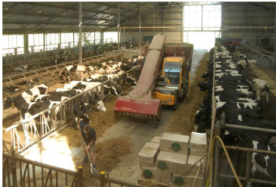
Ligboxenstal met melkkoeien

De huisvesting van biologisch melkvee wijkt niet wezenlijk af van dat van regulier melkvee. Een gangbare ligboxenstal voldoet, mits er voldoende dichte vloer aanwezig is. Op een aantal biologische bedrijven wordt het melkvee in een potstal op stro gehouden. Opslag van stro in het stalverblijf komt daarbij voor. Voor biologisch melkvee is weidegang in het groeiseizoen verplicht.