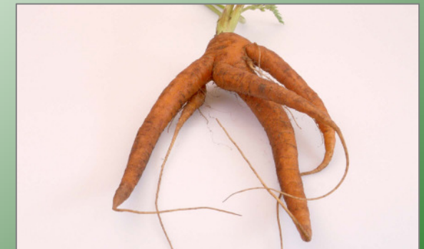
Beinige Möhren nach Befall mit Trichodorus .

Unterirdisch: Nematoden befallen die Wurzelspitze => die Wurzel wächst zur Seite und verzweigt; Verzweigung nur an der Hauptwurzel, nicht an den Seitenwurzeln.