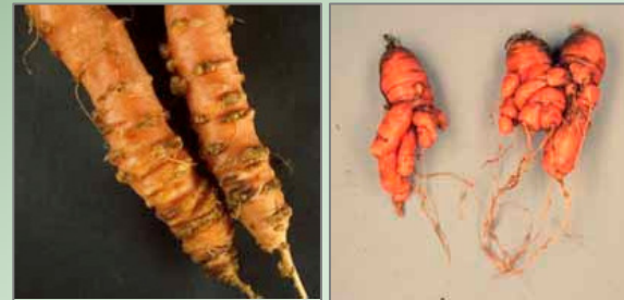
Symptome von Meloidogyne chitwoodi & M. fallax (links) bzw. M. hapla (rechts).

( M. chitwoodi / M. fallax : Bohnen, Tagetes; M. hapla : Getreide), resistente Zwischenfrüchte (z. B. Ölrettich).