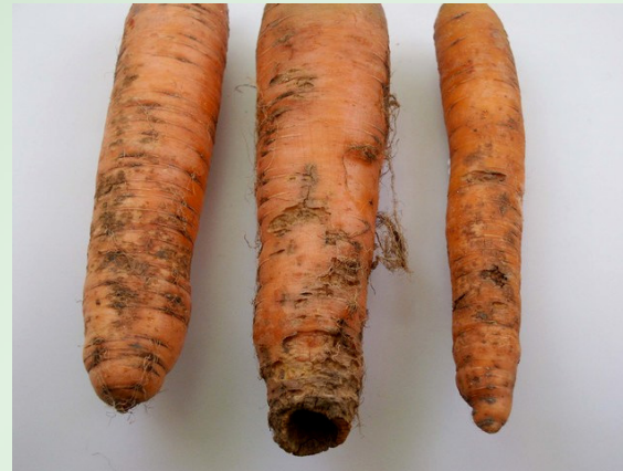
Schadbild von Paratylenchus spp.

Kein Anbau von Doldenblütlern wie Möhren, (Knollen)-Sellerie und Fenchel in enger Folge mit Kohl.