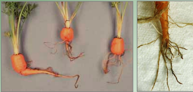
Schadbild von Pratylenchus penetrans

Unterirdisch: Möhrenkörper kurz und stumpf gerundet; feines, teils stark verzweigtes Wurzelsystem in Verbindung mit braun verfärbten Läsionen.