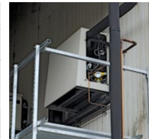
▲ De warmtewisselaar draagt de koude van het propaan over aan de CO 2 .