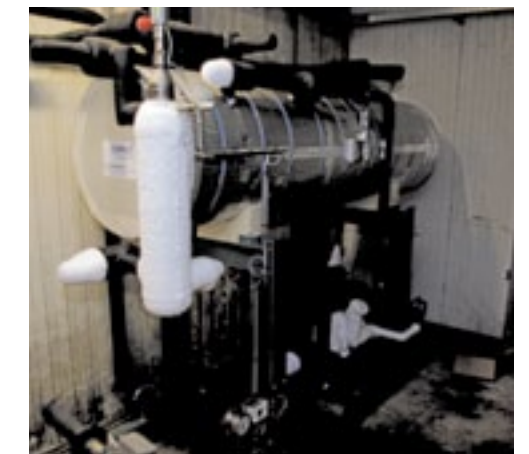
▲ Het voorraadvat met CO 2 moet constant gekoeld worden.

identiek aan de gangbare koelsystemen, met dit verschil dat de warmtewisselaar de warmte niet uit de cel haalt, maar uit het secundaire circuit.