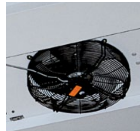
▲ Het secundaire circuit van de CO 2 -propaaninstallatie is gevuld met CO 2 .