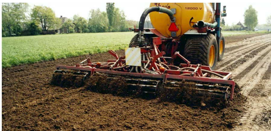
Injecteren geeft een goede mestbenutting

Ondiep inwerken kan men naast in tabel 5.20 genoemde methoden ook realiseren door diepe injectie voor ploegen. Wanneer de mest niet direct wordt ingewerkt (maar pas na circa 1 uur) moet men rekening houden met 10% lagere werking.