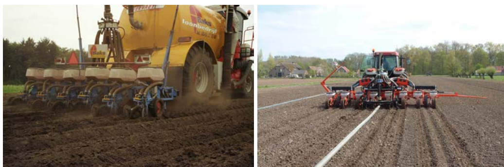
Zaaien en rijenbemesting met drijfmest in één werkgang Tegenwoordig kan dit ook in aparte werkgangen m.b.v. rtk-gps besturing

Men kan ook de drijfmest tijdens het zaaien in één werkgang toedienen. De drijfmest wordt daarbij aan beide kanten op een afstand van 8-10 cm van de rij geïnjecteerd. De machine bestaat uit een drijfmesttank waarachter een zaaimachine is gebouwd. Dit systeem is minder geschikt voor structuurgevoelige gronden. Daarom is er ook al een systeem ontwikkeld waarbij de drijfmest wordt aangevoerd met een sleepslangensysteem. Rijenbemesting met dierlijke mest geeft een betere werking van stikstof en fosfaat dan een vollelds toediening. Evenals bij rijenbemesting met kunstmest wordt voor stikstof de factor 1,25 aangehouden. De betere werking van fosfaat is sinds 2010 in het advies geïntegreerd. Bij rijenbemesting met drijfmest is het over het algemeen niet mogelijk om meer dan 35-40 m 3 per ha netjes te injecteren. Veel loonwerkers ervaren de lagere zaaicapaciteit als bezwaarlijk. Tegenwoordig is het mogelijk om de rijenbemesting met drijfmest en het maïs zaaien in aparte werkgangen uit te voeren. De drijfmest wordt daarbij als rijenbemesting aangewend op 75 cm rijafstand m.b.v. automatische besturing met rtk-gps en deze gegevens worden daarna gebruikt door de trekker met de zaaimachine. Door deze methode is de zaaicapaciteit niet meer afhankelijk van de mest aanvoer capaciteit.