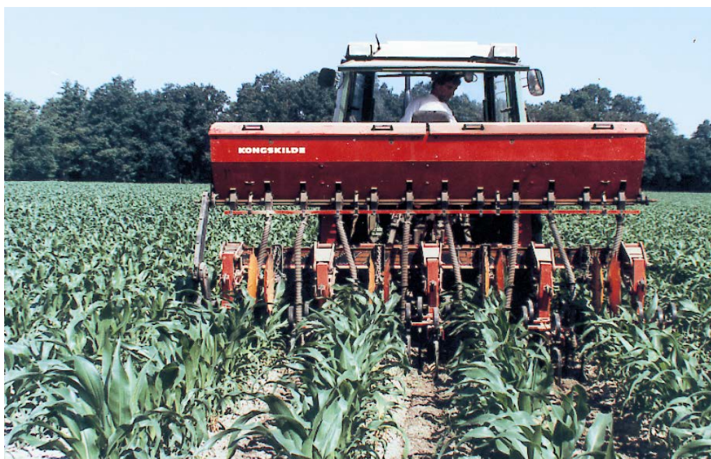
Bijbemesten is mogelijk tot het 6-bladstadium

Een Nmin-bepaling is alleen zinvol als het voorjaar uitzonderlijk koud en nat was waardoor twijfels bestaan over de beschikbaarheid van voldoende Nmin door geringe mineralisatie. Een bemesting na opkomst en vóór het 6-bladstadium is alleen lonend als de hoeveelheid Nmin lager is dan 175 kg/ha. In het algemeen wordt een strategie met gedeelde giften niet aanbevolen. De bemonstering voor de Nmin-bepaling voor het advies in juni dient 15 tot 20 cm naast de rij plaats te vinden en in het 3- of 4-bladstadium, zodat men een eventuele bemesting voor het 6-bladstadium kan uitvoeren.