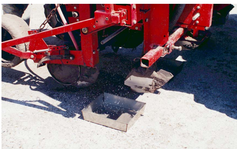
Rijenbemesting stimuleert de jeugdgroei van maïs