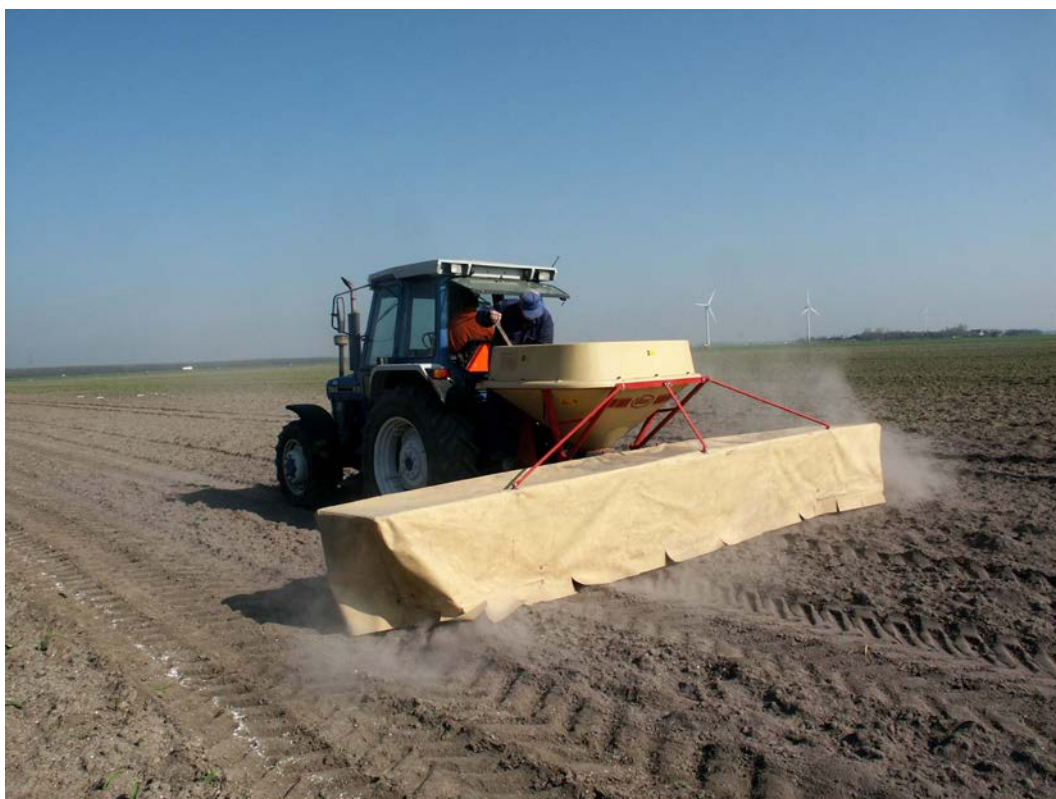
Een goede pH is een eerste vereiste

Bij giften groter dan 4000 kg nw adviseren we deze giften in meerdere keren te geven. In het algemeen worden giften groter dan 8000 kg nw niet geadviseerd. Pas vlak na een bekalking geen N-bemesting toe met een minerale meststof die ammonium bevat en/of organische mest, omdat dan extra verliezen uit deze meststoffen kunnen optreden.