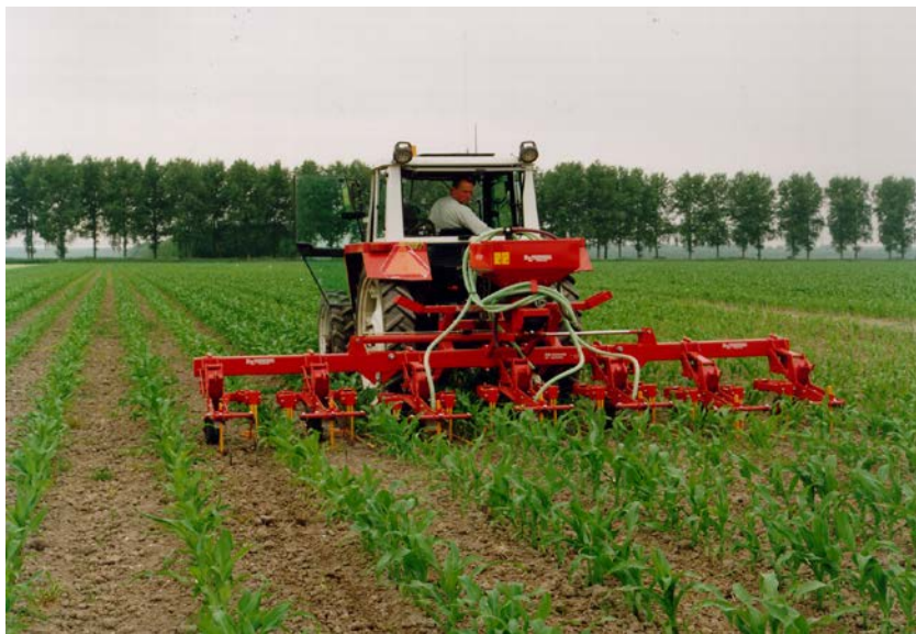
Gras onderzaaien vermindert nitraatuitspoeling

Bij onderzaai van gras dient men enigszins rekening te houden met het gebruik van verschillende bodemherbiciden bij de onkruidbestrijding. (zie hoofdstuk 8).