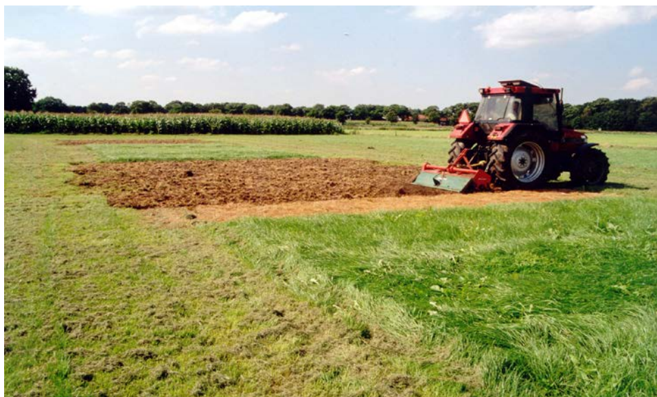
Bij scheuren komt veel stikstof vrij

Uit de ondergeploegde zode komt naast stikstof en kali ook fosfaat vrij. Hierover zijn echter geen onderzoeksgegevens bekend. Als richtlijn wordt daarom aangehouden dat de verhouding tussen stikstof en fosfaat die vrijkomt door mineralisatie van de ondergeploegde zode overeen komt met de verhouding tussen stikstof en fosfaat in het gras. De N : P 2 O 5 verhouding in gras is ongeveer 1 : 0,4. Dit betekent dat wanneer er bijvoorbeeld 100 kg stikstof uit de zode vrijkomt er daarnaast 40 kg fosfaat vrijkomt.