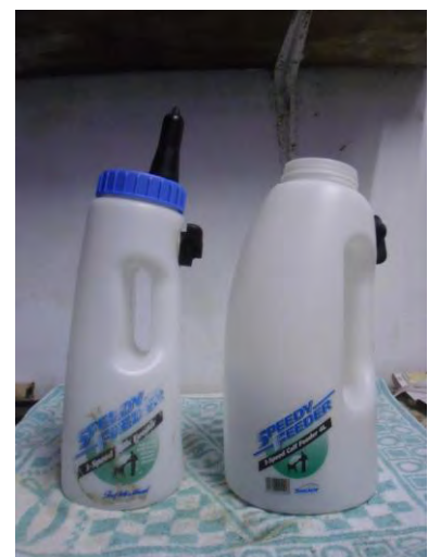
Kerlb Speedy Feeder®