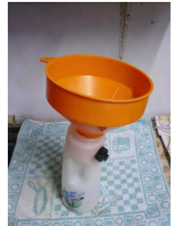
Fles vullen met trechter

De biest kan rechtstreeks vanuit de emmer in de fles gegoten worden. Wanneer dit onhandig is kan er ook gebruik gemaakt worden van een trechter. Hierbij is het praktisch wanneer er gebruik gemaakt wordt van een trechter met een iets opstaande rand, zodat er minder biest gemorst wordt en de trechter goed hanteerbaar is.