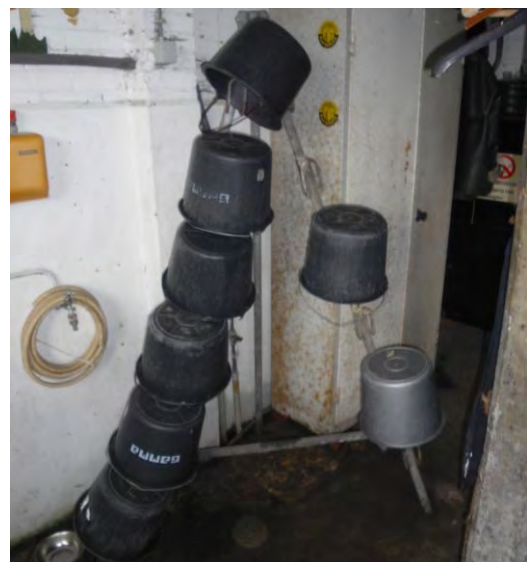
Manieren van het laten opdrogen van emmers