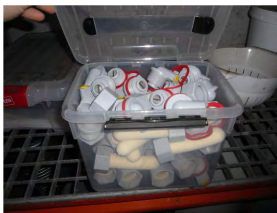
Onderdelen speenemmer bewaren