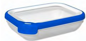
Curver Chef@home® bakje 1.2L

De voorkeur gaat uit naar de Curver Chef@home® bakjes met een volume van 1,2 liter. Het voordeel is dat dit een plat bakje met een groot contact oppervlak is en eenvoudig te reinigen is.