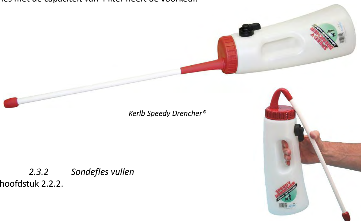
Kerlb Speedy Drencher®

De voorkeur gaat uit naar de Kerlb Speedy Drencher®, zie onderstaande foto. Deze voldoet aan bovenstaande eisen. Hij heeft daarnaast een extra voordeel dat het sonde gedeelte verwijderd en vervangen kan worden door een dop met een speen, zodat het ook kan dienen als drinkfles. Er zijn twee typen met een verschillend volume beschikbaar op de markt van respectievelijk 2,5 en 4 liter. De fles met de capaciteit van 4 liter heeft de voorkeur.