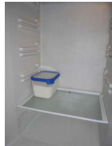
Biest bewaren in koelkast

De bakjes (Curver Chef@home®) op de foto hebben een inhoud van 2,5 liter. Bij andere gewenste hoeveelheden per voerbeurt zijn er ook bakjes in ander maten verkrijgbaar, namelijk 1,2 liter / 1,8 liter / 2,4 liter / 2,5 liter / 4 liter / 5,4 liter / 6,5 liter.