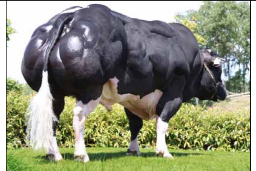
ADAJIO DE BRAY (EMPIRE X EMIGRÉ SF)

Dat de stier breed in het veld doordringt, is volgens de fokker geen toeval. 'Met Empire d'Ochain gaat Adajio toch een beetje weg van de traditionelere bloedvoeringen.' Er zijn meer beweegredenen, denkt hij. 'Adajio geeft consequent goede nakomelingen. Hij past ook op veel dieren.' Hij concludeert voorzichtig: 'Misschien is dit wel een van de beste reproductiestieren van het moment.'