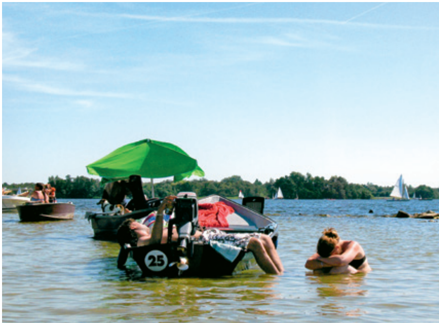
De Ankeveense Plassen op de eerste tropische dag van 2012 (18 augustus).

van vele andere burgers. Daarom biedt zo'n verhaal ook goede aanknopingspunten voor gesprekken en activiteiten met burgers. Een mooi voorbeeld zijn de activiteiten in het kader van de Natuurkalender. Natuuronderzoek en natuurbeleving gaan in dergelijk onderzoek hand in hand, eigenlijk niet anders dan bij pioniers zoals Jac. P. Thijsse. Het nieuwe verhaal is dus ook niet helemaal nieuw, al moet er misschien wel wat stof worden weggeblazen. Cruciaal voor de toekomst van de natuurbescherming is dat ook kinderen in dit verhaal betrokken worden, onderzoekend en spelend.