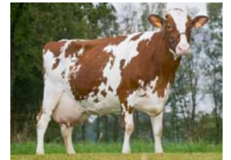
Ramala, productiefste roodbontvaars in het mpr-jaar 2010-2011

Als men het over Classic heeft, verwijst men steeds naar de exterieurcapaciteiten van deze stier. Ik zou graag een ander aspect van deze alleskunner onder de aandacht willen brengen, namelijk de