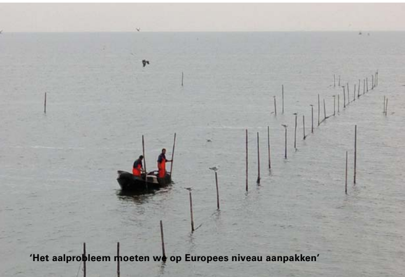
'Het aalprobleem moeten we op Europees niveau aanpakken'

evenredige teruggang van de visserij-inspanning en totale visvangst tot gevolg te hebben. Er wordt door meerdere partijen betwist of de sanering van het aan-