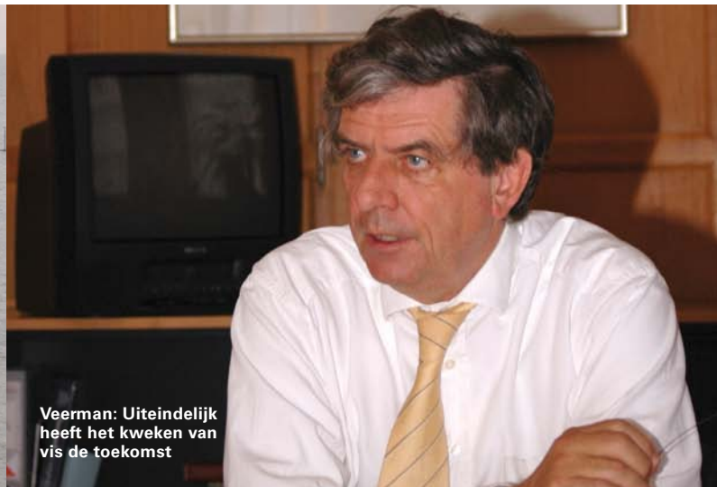
Veerman: Uiteindelijk heeft het kweken van vis de toekomst