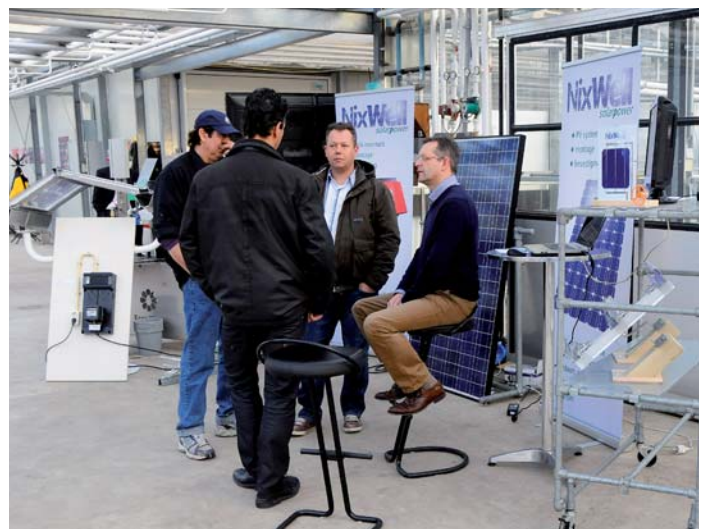
Zonne-energie biedt kansen voor energiebesparing