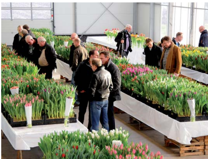
Overzicht van de marktbroeishow