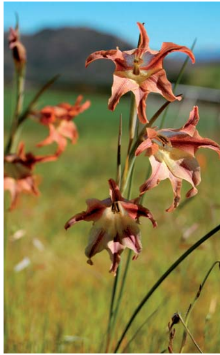
In Zuid-Afrika is een groot aantal soorten van het geslacht Gladiolus te vinden

gevraagde cultivars al heel snel in de vergetelheid kunnen verdwijnen. Er zijn maar weinig gladiolen in het sortiment die ouder zijn dan twintig jaar. De Nederlandse veredelaars slagen er elk jaar weer in een aantal nieuwigheden op de markt te brengen die grote kans maken om in het wereldhandelsassortiment te worden opgenomen. In elk seizoen zien we dan ook veranderingen in het kleurenpalet en het bloemtype van de gladiool. De toekomst van de gladiolen ligt zodoende deels in handen van de veredelaars.