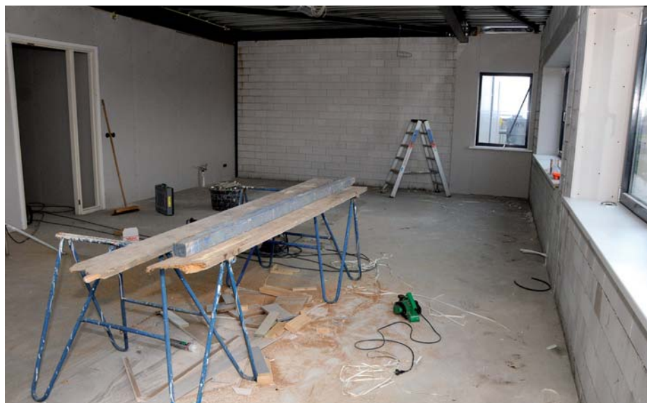
De komende tijd wordt de laatste hand gelegd aan de inrichting van kantoor en kantine

dat even een kijkje werd genomen. In de eerste van de twee kassen worden sinds begin oktober 'Paperwhite' en 'Grand Soleil d'Or' in bloei getrokken. In de twee kas is eind november alles klaar om ook daar met de broeierij te gaan starten. Dirk Leenen legt hier de laatste hand aan. Buiten, naast de verwerkingshal, bewijst een van de docklevelers zijn gemak. Een container is bijna geladen voor zeetransport. Nu alles gelijkvloers is, is het laden geen tijdrovend karwei meer. Binnen een half uur is de wagen gevuld met de benodigde inhoud.