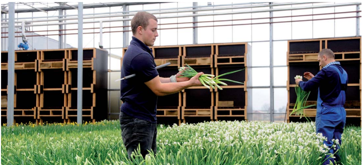
In de kas wordt inmiddels volop gebroeid en geoogst