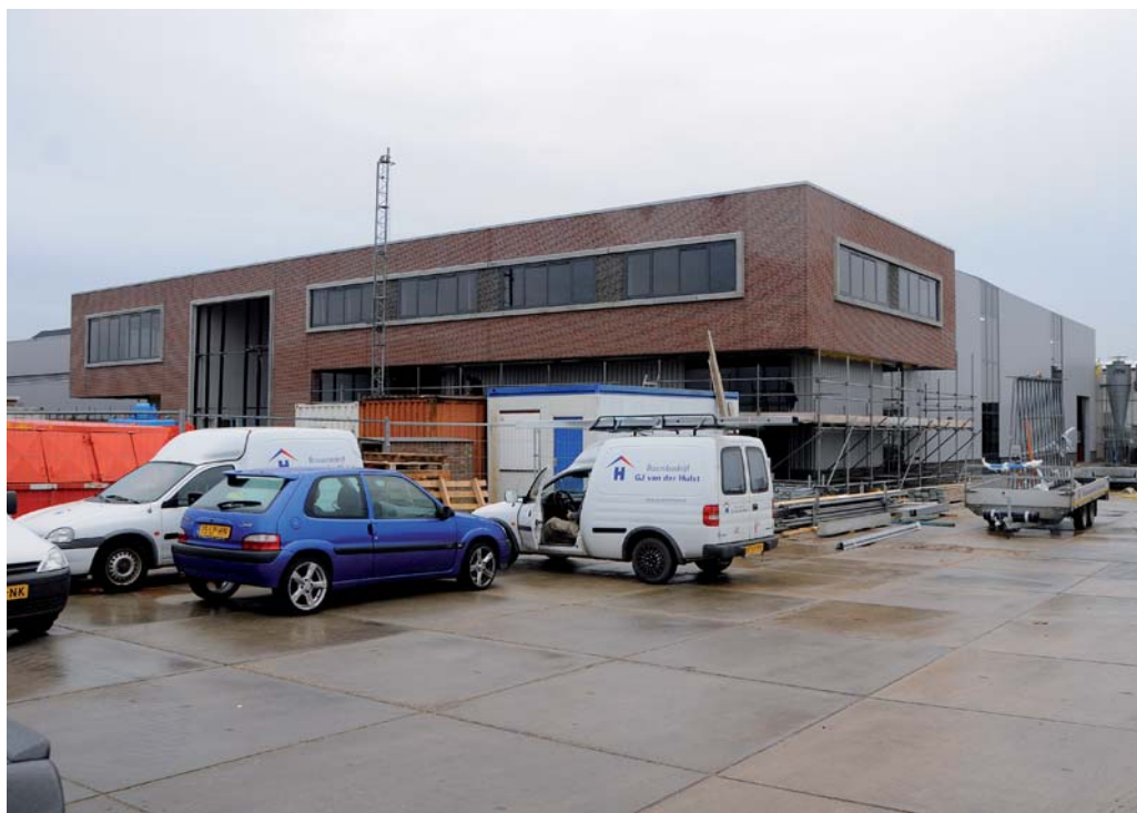
Het metselwerk aan de voorgevel is klaar

Tekst: Arie Dwarswaard