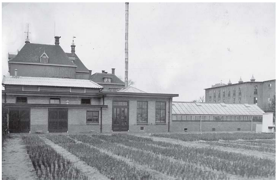
Achter de school werd een kas gebouwd en een werkruimte voor de proeftuin die bij de school hoorde

In de periode dat de school werd opgericht was de bloembollensector al gevarieerd in zijn bedrijfstypen. Naast de vele exportbedrijven met kwekerij kwamen er ook steeds meer teeltbedrijven. De school wilde leerlingen een zo breed mogelijke opleiding geven, en dus was de samenstelling van de vakken daar op afgestemd. Naast teeltkundige vakken, zoals plantkunde en bemestingsleer, werden ook vakken op het gebied van boekhouding en handelscorrespondentie in talen als Duits, Zweeds en Russisch gegeven. En na de Tweede Wereldoorlog konden leerlingen die reiziger wilden worden ook lessen volgen in het deelnemen aan een gesprek als zij in het buitenland met klanten gingen dineren. Omdat er bij de bloembollenteelt veel praktijkkennis komt kijken, werd al snel achter de school een eigen proefschooltuinbedrijf gevestigd. Daar konden leerlingen zelf proefondervindelijk bepalen wat er wel en wat er niet werkt. Dat kon zowel in de kas als op de erachter gelegen proefvelden. De vestiging van het daar aan grenzende latere LBO maakte het voor leerlingen en leraren mogelijk om het bloembollonderzoek op de voet te volgen.