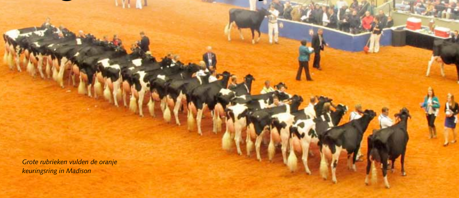
Grote rubrieken vulden de oranje keuringsring in Madison

De eigenaren van Harvue Roy Frosty waren erop gebrand dat hun koe geschiedenis zou schrijven door een derde overwinning op de World Dairy Expo. De Canadese Hailey gooide echter roet in het eten in Madison, waar dieren met hoge genoomfokwaarden en het gen voor hoornloosheid de veilingtoppers waren.